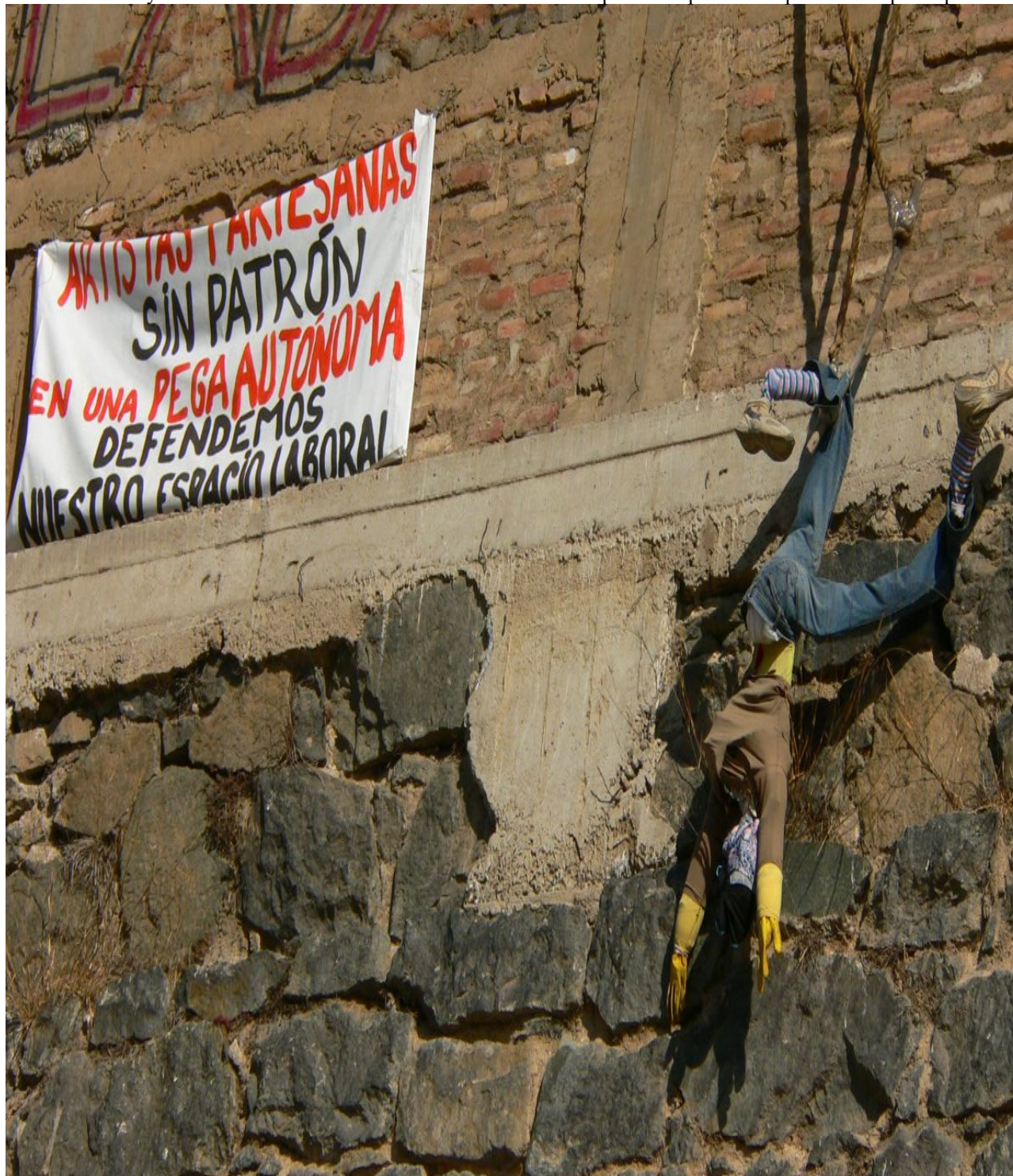
Muro perimetral de la Ex Cárcel de Valparaíso (2008).

Retrazando los distintos argumentos llevados a la escena pública a lo largo del periodo estudiado, el trabajo evidencia cómo el antiguo penal se convierte en el objeto de una causa ciudadana, en la medida en que las sucesivas reivindicaciones en torno a él van articulando la defensa del espacio a una idea de bien común. Movilizada por una diversidad de actores, esta causa es construida, por una parte, desde el rechazo de las dinámicas de privatización y de mercantilización del espacio urbano, que se visibiliza a través del lema “No a la venta de la Ex cárcel” (2002-2003). Por otra parte, la denuncia del centralismo y del verticalismo en la gestión institucional de los dos proyectos arquitectónicos antes mencionados, hace manifiesta las contradicciones de los discursos oficiales sobre la participación ciudadana.