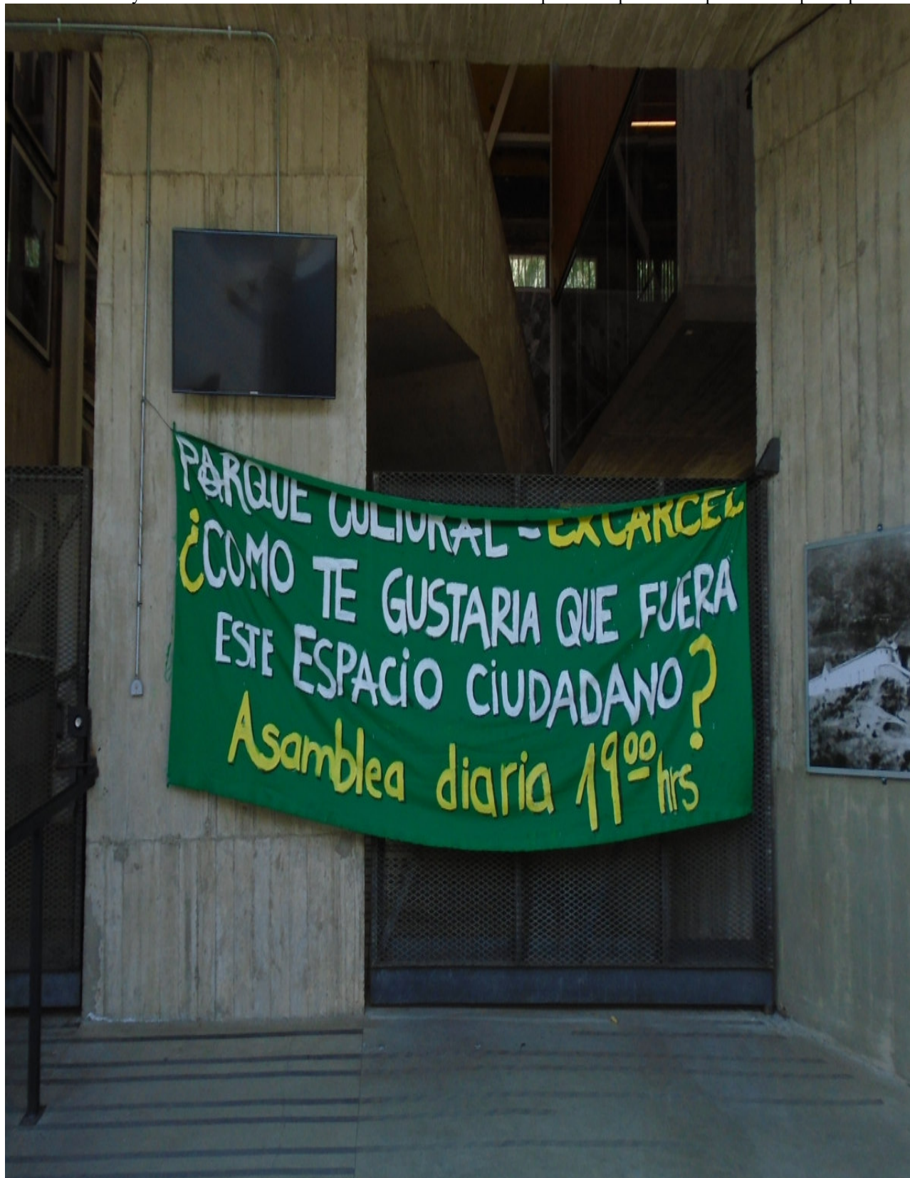
Parque cultural de Valparaíso (2018), foto de la autora.

Por un lado, esta administración transitoria busca favorecer un proyecto participativo, no sólo a partir del quehacer cultural entendido en un sentido vasto, sino también apoyándose en un incipiente reconocimiento de los valores memoriales y patrimoniales de la Ex cárcel, en espera de que la nueva función del lugar sea definida. Por otro lado, desde el nivel central se apunta sobre todo a poner los terrenos del antiguo penal al servicio de un programa de reactivación económica de la ciudad-puerto, aun si ello conlleva la demolición del edificio: Se trata de una perspectiva directamente ligada a la campaña por la declaratoria del casco histórico de Valparaíso como patrimonio mundial por la Unesco, obtenida en 2003. La declaratoria constituye un elemento central de las políticas de