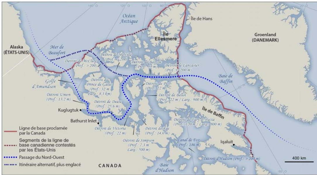
Figure 2. Le Passage du Nord-Ouest

Réalisation : Département de géographie, Université Laval, 2016