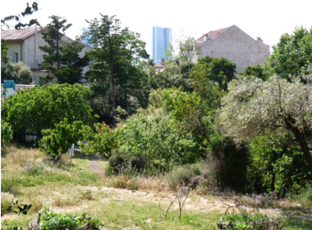
Figures 11a et b. Le jardin Levat depuis la rue et intra-muros (clichés : Zoé Hagel).

Après le départ, en 2016, des religieuses, l'ensemble d'1,7 ha (bâtiments et jardins) est acquis par la ville de Marseille en