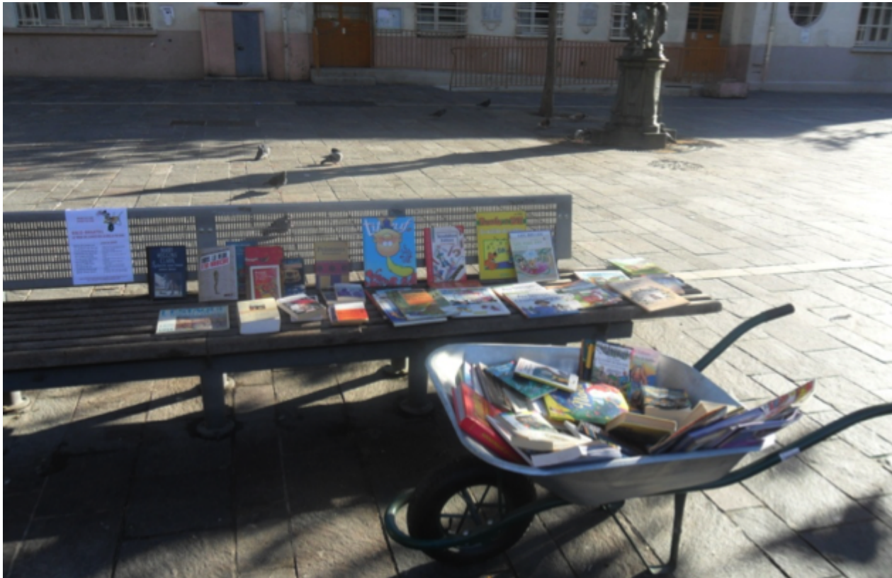
Figures 6a et b. Affiche revendiquant l'ouverture d'une bibliothèque et installation temporaire en extérieur.

Dans un même temps, il assure une veille sur les locaux vacants potentiellement aménageables en bibliothèque afin d'interpeller les collectivités responsables de la programmation de ce type d'équipement. Le collectif refuse en effet de se substituer aux acteurs institutionnels concernés. Le « Manifeste pour une bibliothèque publique dans le 3 e » affirme ainsi qu'« aucune solution bricolée ne pourra se substituer à l'exigence de notre collectif d'un équipement public de qualité, géré par des professionnels et digne des habitants du 3 e , citoyens à part entière de la ville de Marseille » 15 .