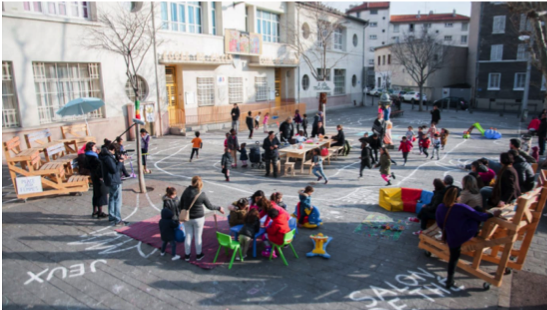
Figures 5a et b. Actions du groupe Passer'elles : affiches sur les murs de la Maison Pour Tous et réaménagement de la place Cadenat (clichés : Brigitte Bertoncello ; MPT Belle de Mai / Formes Vives / Collectif ETC).

Face au faible investissement des politiques publiques nationales et locales, ressenti comme un « abandon », une partie des populations arrivées par choix s'est par ailleurs constituée en collectifs ou associations pour instaurer les habitants comme acteurs du développement de leur quartier et s'assurer d'une prise en compte des enjeux qu'ils identifient en matière d'urbanisme.