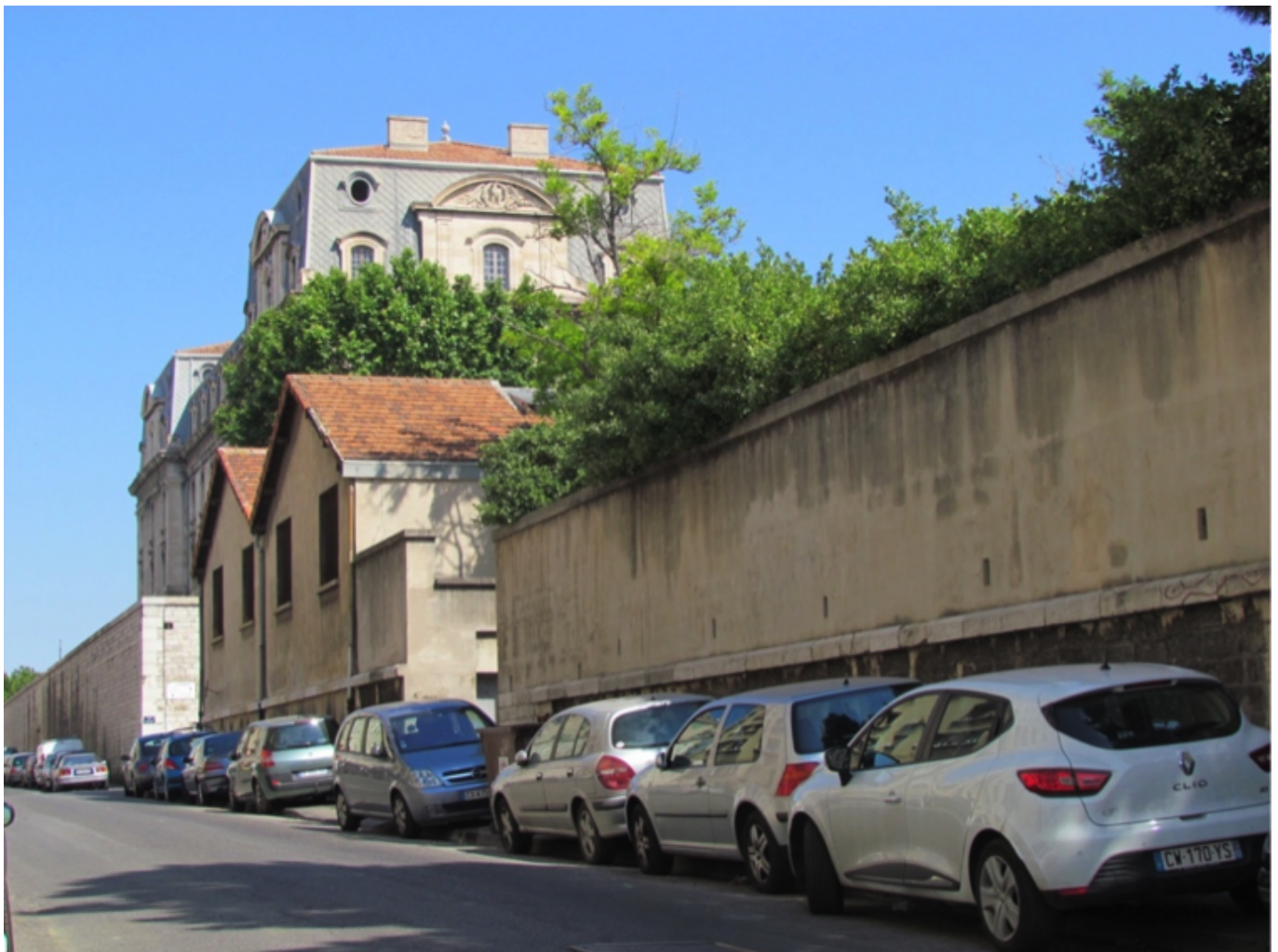
Figure 2. Effets de coupure et murs d'enceinte aveugle.

Pour le reste, le diagnostic est partagé par l'ensemble des acteurs. Proche du centre-ville, la Belle-de-Mai est caractérisée par une accessibilité problématique, des équipements et des espaces publics déficients en qualité et en nombre. Bordée et traversée par des infrastructures routières et ferroviaires (figure 1), elle subit en outre des effets de coupure (Héran, 2011 10 ) que vient renforcer l'emprise de certains îlots et équipements délimités par de hauts murs d'enceinte pour la plupart aveugles : anciennes casernes (figure 2) et manufactures du XIX e siècle, couvent de religieuses vivant cloîtrées et même La Friche (figure 3), pôle culturel d'envergure internationale par lequel le quartier est connu.