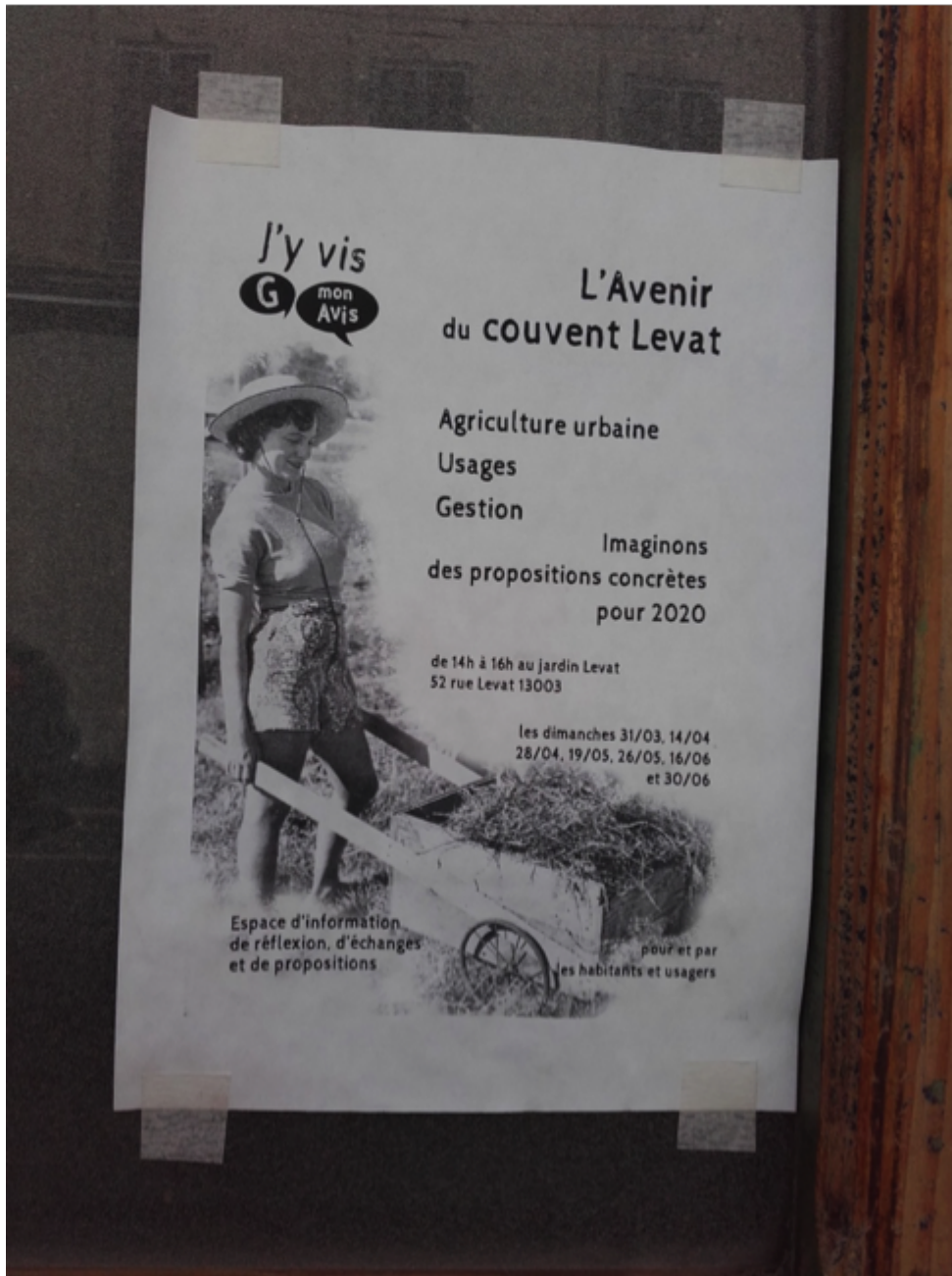
Figure 9a et b. Affiches du collectif « J'y vis, G mon avis » (source : page Facebook des Citoyens du 3 e , Marseille, Brigitte Bertoncello).

Forts de leur présence quotidienne dans le 3 e arrondissement et de leurs vécus, ces collectifs produisent notamment de la donnée sensible et actualisée, rendue visible tant par des actions dans les espaces publics que par une diffusion sur Internet à travers blogs et réseaux sociaux. Le service en charge de l'opération Quartiers Libres et le groupement lauréat du dialogue compétitif articulé autour des mandataires Güller et Güller-TVK, se rapprochent de certains d'entre eux et mobilisent leurs connaissances à diverses étapes du projet, notamment sur les espaces publics. Repérés comme un des éléments majeurs de la demande d'amélioration de la qualité de vie formulée par les participants lors de la phase de concertation préalable, ces