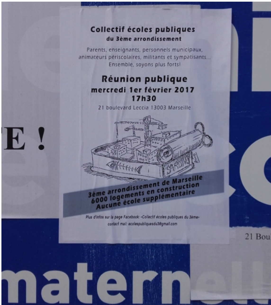
Figure 8. Affiches du collectif « Écoles publiques du 3 e arrondissement », mur de l'école Busserade.

À l'image de ces deux illustrations, d'autres collectifs et associations interviennent dans le quartier sur des sujets définis comme prioritaires à partir de leurs diagnostics respectifs et engageant individuellement ou ensemble des actions qui les positionnent dans le champ de l'urbanisme. Cette nébuleuse d'acteurs à géométrie variable est en redéfinition permanente en fonction des actualités, parmi lesquelles le projet Quartiers Libres. L'important pour les participants n'est pas tant d'où ils parlent que ce qu'ils font avancer collectivement (entretiens Brouettes & Compagnie, J'y vis, An 02, collectif 3B...).