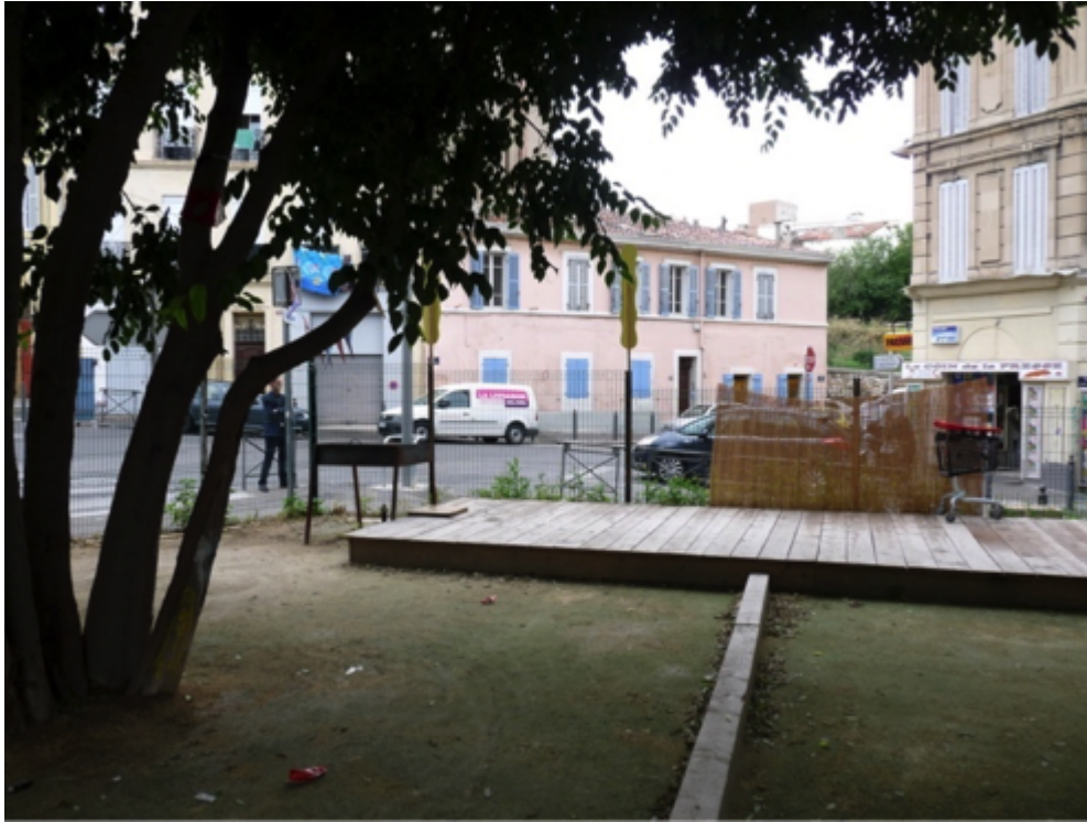
Figures 12a et b. Aménagement du Coin pour Tous.