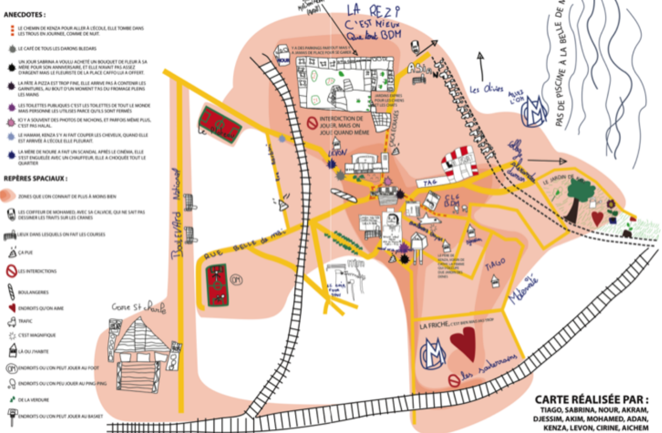
Figure 13. Diagnostic sensible réalisé par les jeunes associés au projet du « Renté ».