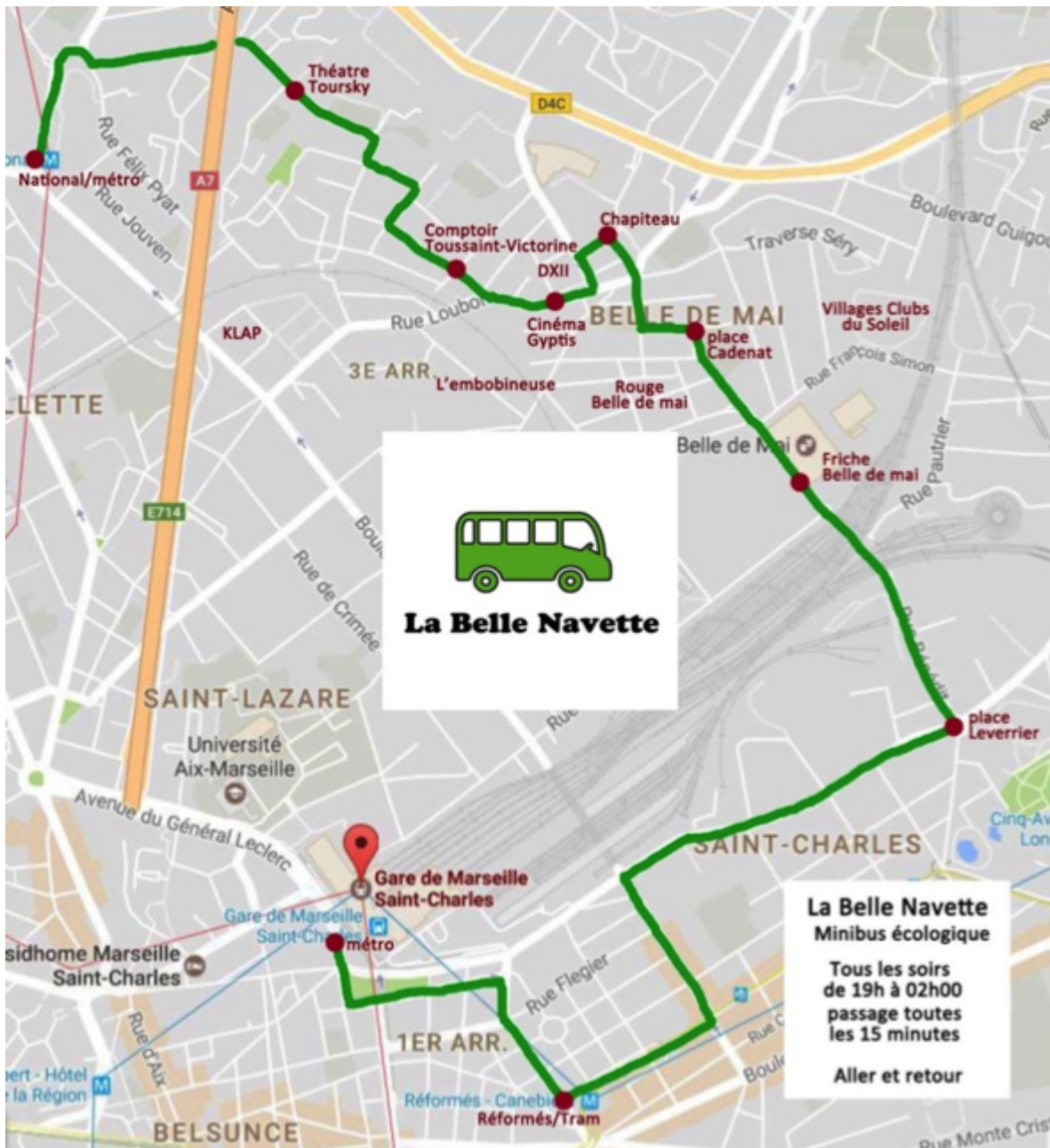
Figure 7. Plan de la Belle Navette proposé par Brouettes & Compagnie.

Le sujet des mobilités, resté en suspens, sera quelques années plus tard au cœur des ateliers thématiques du projet Quartiers Libres auxquels des initiateurs de la réflexion participent.