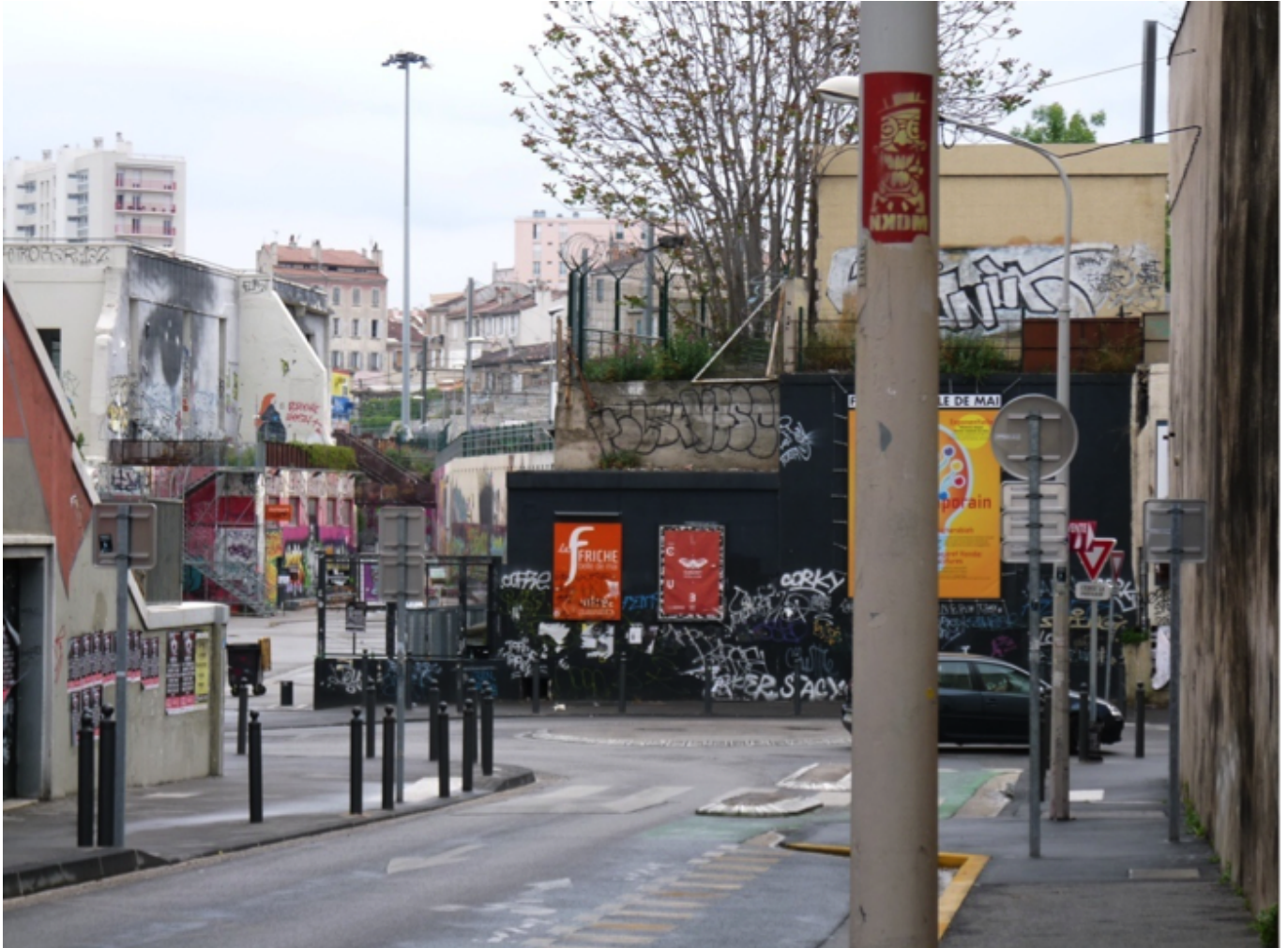
Figure 3. Entrée de la Friche Belle de Mai depuis la rue Guibal.

À la différence de l'image véhiculée à travers les médias, la Friche de la Belle de Mai a été et reste parfois encore perçue comme « un bunker culturel au milieu d'un quartier populaire » (actif culturel du quartier, 14/11/2018), au point que certains habitants ne l'intègrent pas dans leur représentation du quartier.