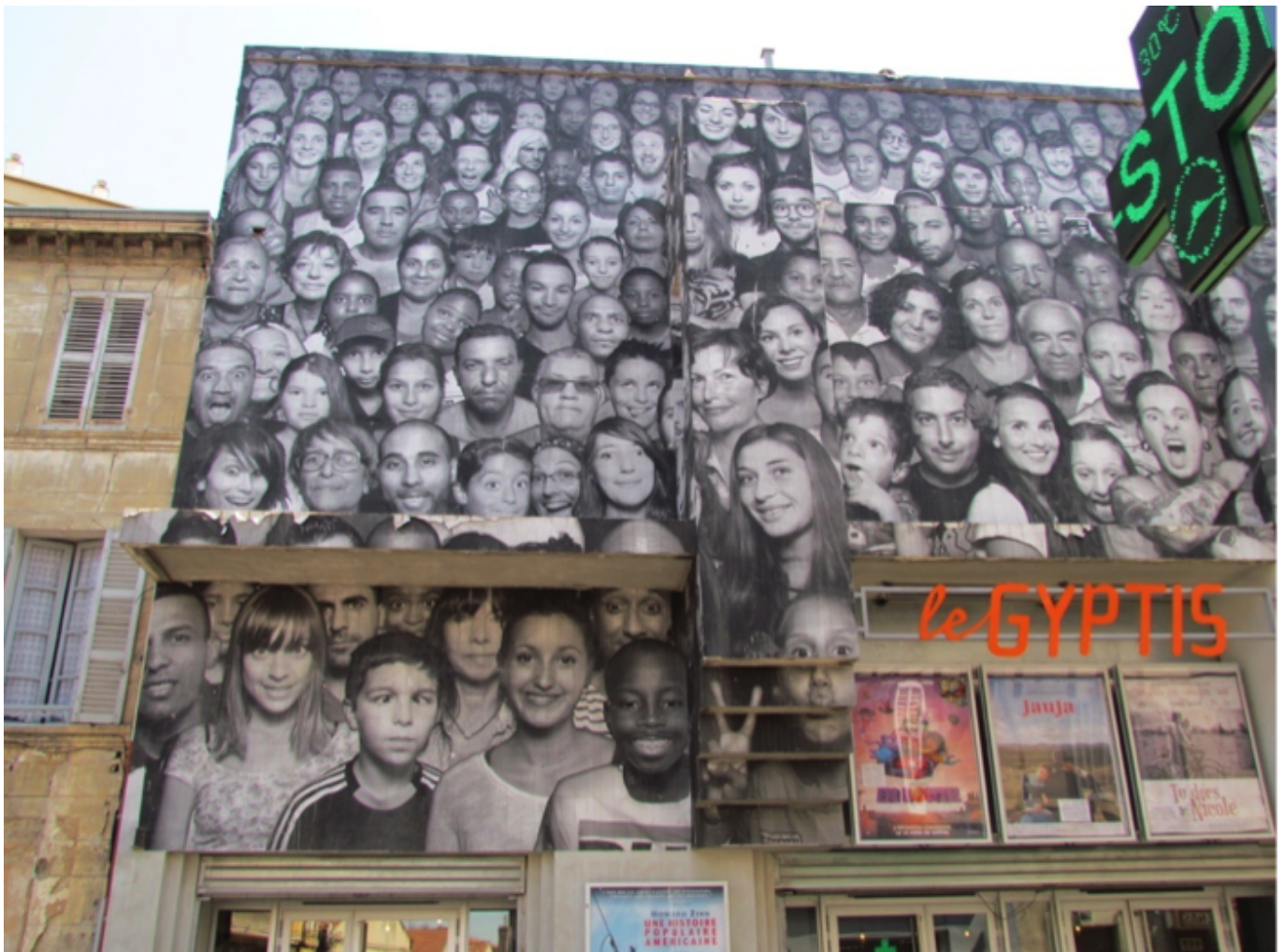
Figure 4. Façade du Gyptis.

schéma directeur initial, d'autres transformations voient en effet le jour au gré des dynamiques de renouvellement urbain. La régie culturelle régionale demande ainsi à la Friche de rouvrir et gérer un ancien lieu de spectacle installé plus au cœur du quartier, place Caffo, halte des bus reliant la Belle de Mai au métro National et aux quartiers nord. Le cinéma qui ouvre alors ses portes fonctionne pour partie sur un mode inspiré du réseau d'éducation populaire « Peuple & culture », proposant notamment un atelier de programmation thématique et participative, en appui sur des projets coconstruits avec des associations locales (entretien, 23/3/2019).