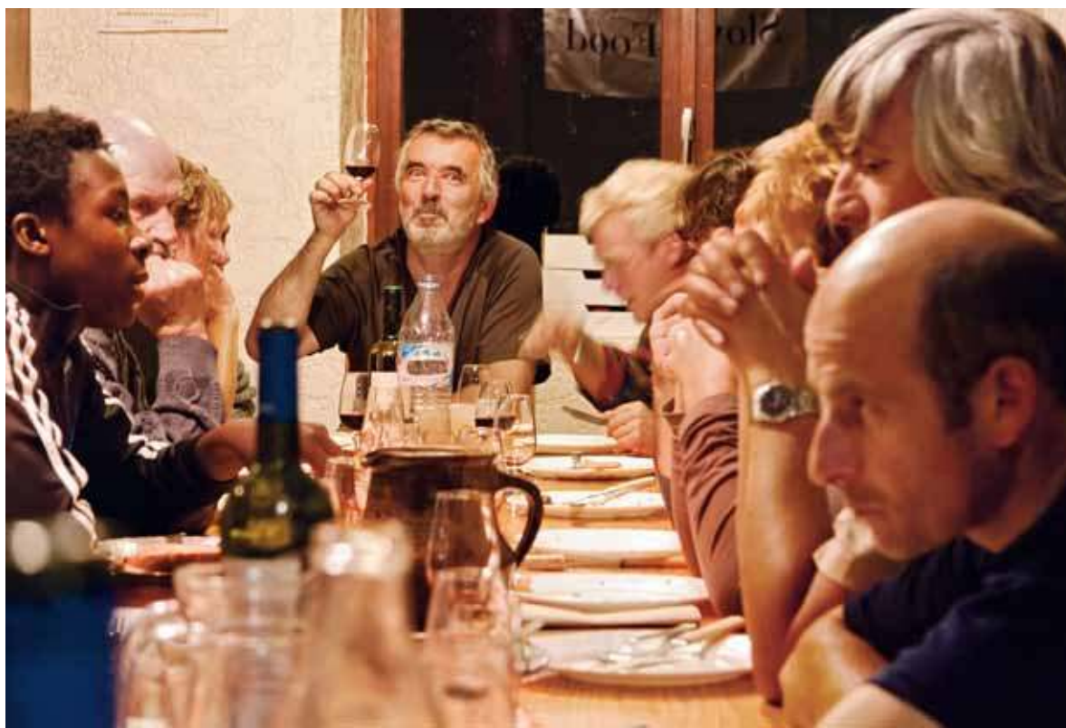
Le « bon » – les bons plats, les bons vins – était la première préoccupation de ces militants, le point de vue du gourmet.

mouvement. Le terme « plaisir » employé n'est pas nouveau non plus. En 1987, le « Manifesto dello Slow Food » (complété du sous-titre « Movimento per il diritto al piacere ») avait été publié dans le Gambero Rosso , supplément mensuel de huit pages édité par l'association à l'intérieur du quotidien de gauche Il Manifesto . En 1989, à Paris, à l'Opéra-Comique, ce manifeste avait été signé publiquement par des personnalités du monde du spectacle, des intellectuels, des chefs cuisiniers,