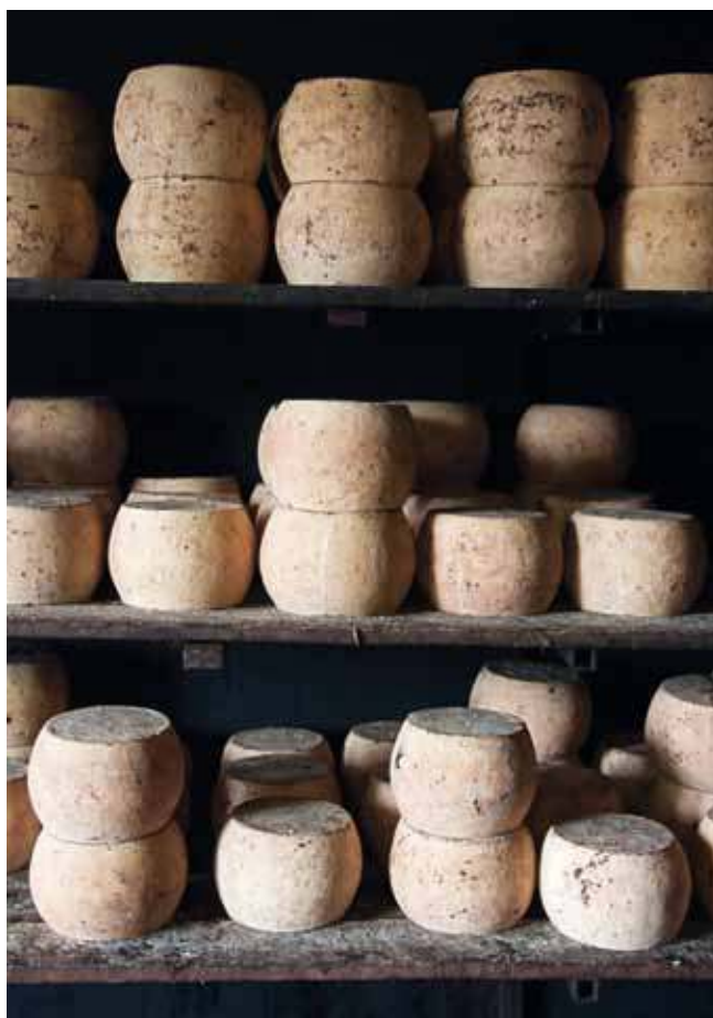
« Tout cela c'est de la biodiversité : elle a la même valeur environnementale et paysagère que la biodiversité spontanée », disent les responsables du mouvement. Le fiore sardo , fromage de brebis, est une des six Sentinelles de Sardaigne.

mais aussi par la redécouverte des productions locales. Sans vraiment abandonner l'un pour l'autre, les domaines d'intervention s'élargissent et se superposent. Au fur et à mesure que les champs d'action se diversifient, de nouvelles philosophies sont forgées, ou englobées et réélaborées, appelant Slow Food à reconfigurer son