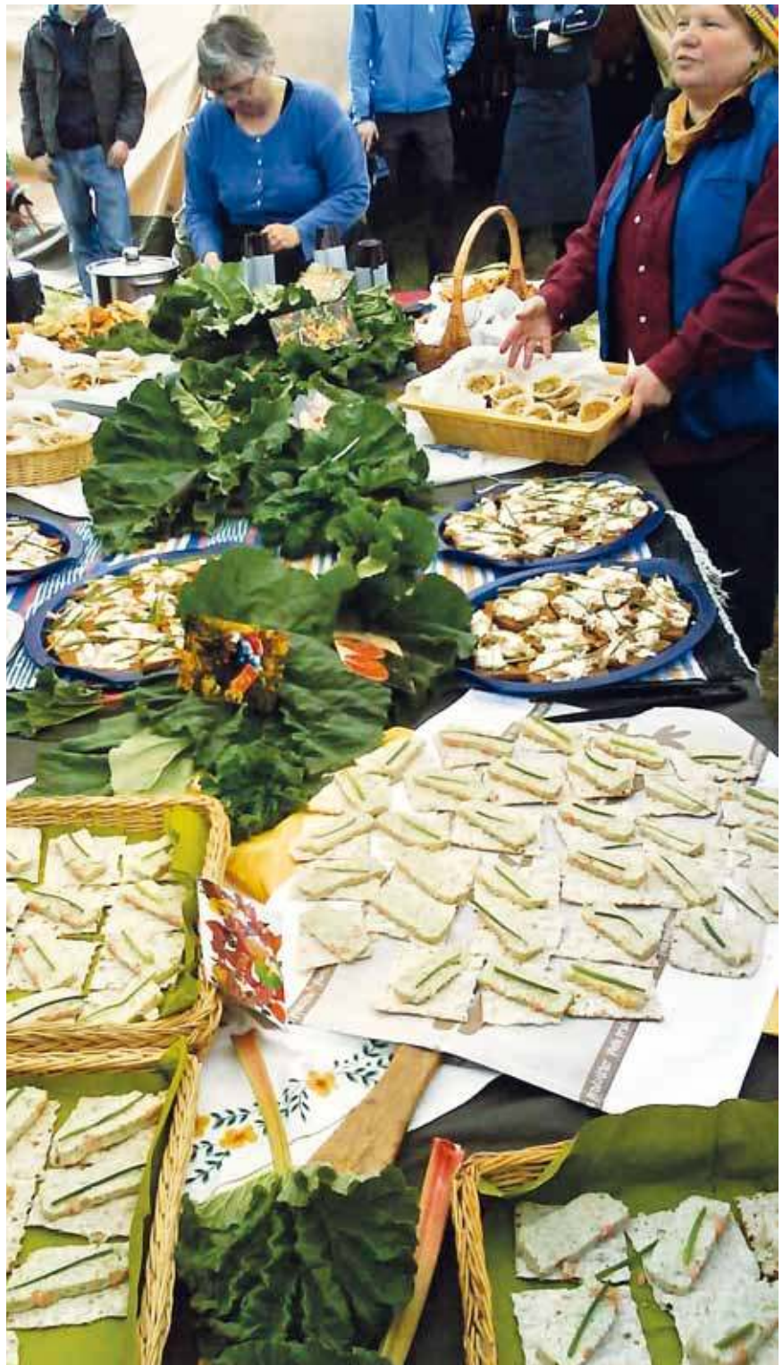
Le terme « communauté de la nourriture » désigne les représentants de « communautés » de petits producteurs du monde entier. Le repas organisé par Slow Food Sami, à Hemavan (nord de la Suède), lors du conseil international en juin 2010.