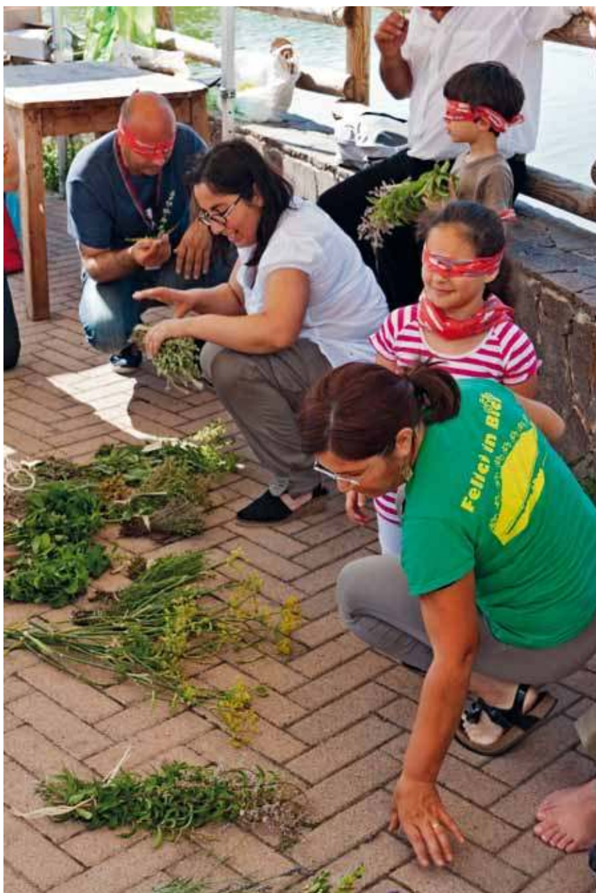
« Bon » fait référence à la qualité gustative des produits alimentaires, perçue par les consommateurs « éduqués » à la reconnaître. Ici, des enfants participent à un atelier de découverte d'herbes aromatiques lors de la fête nationale Slow Food à Cagliari, juin 2011.

« Propre » déplace l'attention vers le lieu et la manière de produire, et vers l'environnement : la notion de propre s'applique aux produits qui respectent l'environnement et fait référence aux manières de produire et aux formes de