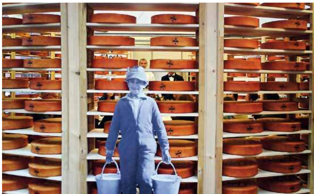
Cheese est l'un des grands meetings internationaux organisé par le mouvement Slow Food. Il est centré sur les productions fromagères du monde entier.