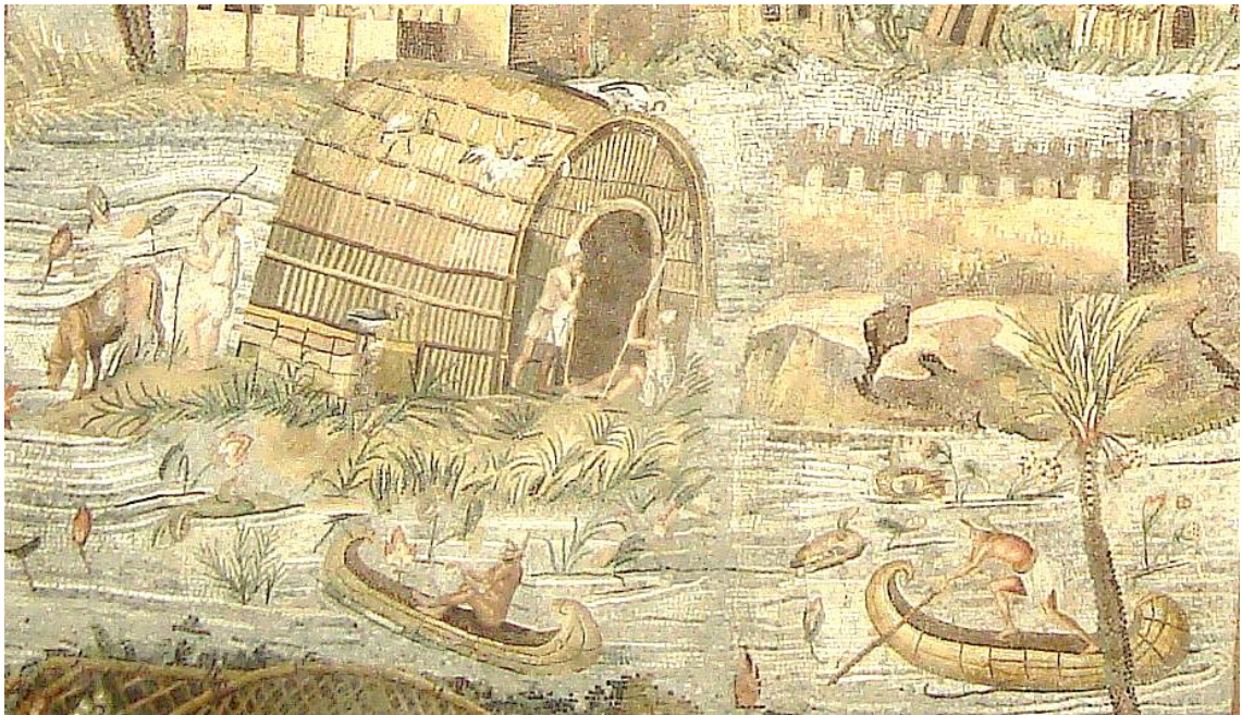
Figure 1 : Mosaïque nilotique (détail) du temple de la Fortune Primigenia à Préneste (vers 80 av. J.-C.) - Palestrina, Palais Barberini

Le locus amoenus , ou paysage plaisant, s'est ici complètement substitué au locus horridus : les eaux, sans y stagner, circulent et impulsent une vie à toute une faune et toute une flore grouillantes, répondant au plan ordonné par une conjugaison divine. Par rapport à une tradition négative du marais, que l'on trouve chez Stace, chez Sénèque ou même chez le Virgile de l' Énéide VI, le tableau de Philostrate semble bien idéalisé, et répond à l'esprit des scènes nilotiques que l'on voit sur les mosaïques (figure 1). Mais il ne comporte pas de contrevérité, seulement une condensation d'effets pour traduire la richesse du milieu palustre, et sa traduction comme espace vécu et agréable. Si l'œuvre a ici une visée esthétique, son inspiration vient de la poésie bucolique, seul contexte où le marais est décrit dans sa réalité naturelle.