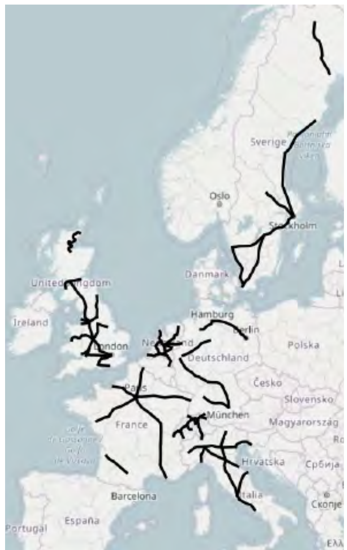
Figure 1 : Cartographie des lignes étudiées.

Cet article entend tester cette hypothèse, en présentant les résultats d'une étude réalisée en 2018 qui avait pour objectif de comparer un large panel de services ferroviaires de type Intercités (90 lignes) dans sept pays européens (Grande-Bretagne, France, Italie, Suisse, Pays-Bas, Allemagne et