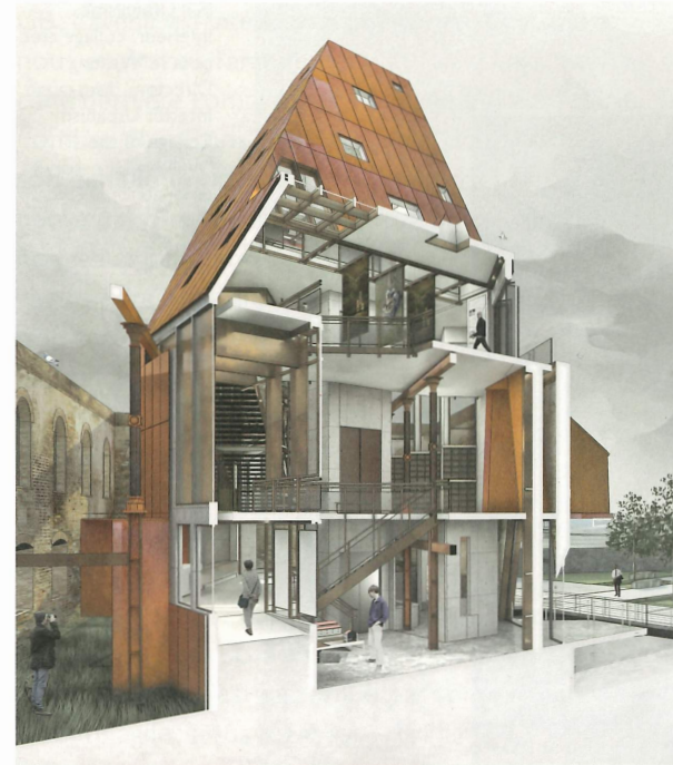
Fig. 2 Réutilisation intérieure: section par le Sheerness War Museum, vers les bastions et la mer, 2019-2020. | Interior Reuse: Section through Sheerness War Museum—to the bastions and sea, 2019-20.