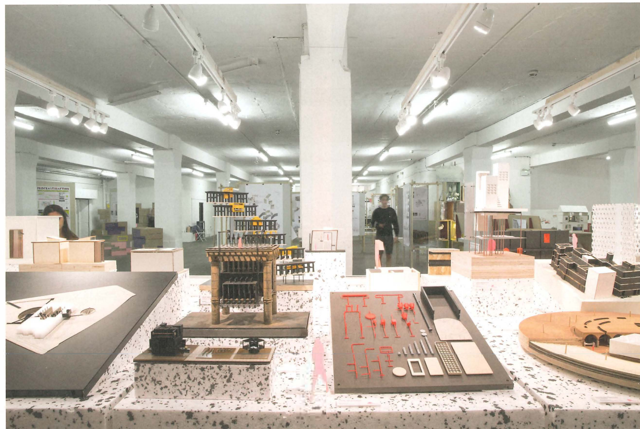
Fig. 1 Exposition Design d'intérieur, Brick Lane Interior Educators Show, Londres, 2018. | Interior Design show at Brick Lane Interior Educators Show, London, 2018.

Marco Costantini (MC): Comment définissez-vous votre pratique pour vos étudiants de première année? Comment traduisez-vous cette pratique en mots?