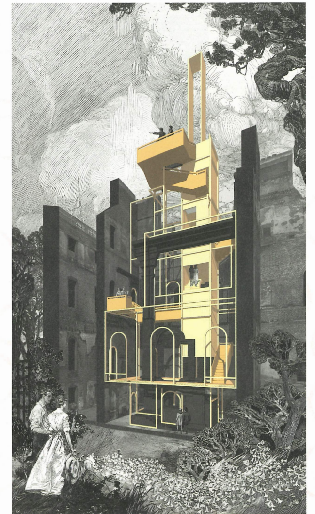
Fig. 3 Clandon Park: La réutilisation du bâtiment acquis par le National Trust, détruit par un incendie en 2015, projet qui s'inscrivait dans le programme de l'Interior Reuse Platform de 2018-2019. | Clandon Park: The reuse of the National Trust building ruined by fire in 2015. Project part of the Interior Reuse Platform work in 2018-19.