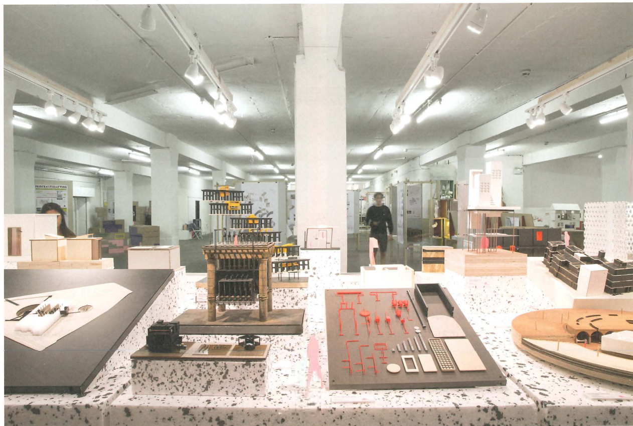
Fig. 1 Exposition Design d'intérieur, Brick Lane Interior Educators Show, Londres, 2018. | Interior Design show at Brick Lane Interior Educators Show, London, 2018.

Marco Costantini (MC): Comment définissez-vous votre pratique pour vos étudiants de première année? Comment traduisez-vous cette pratique en mots?