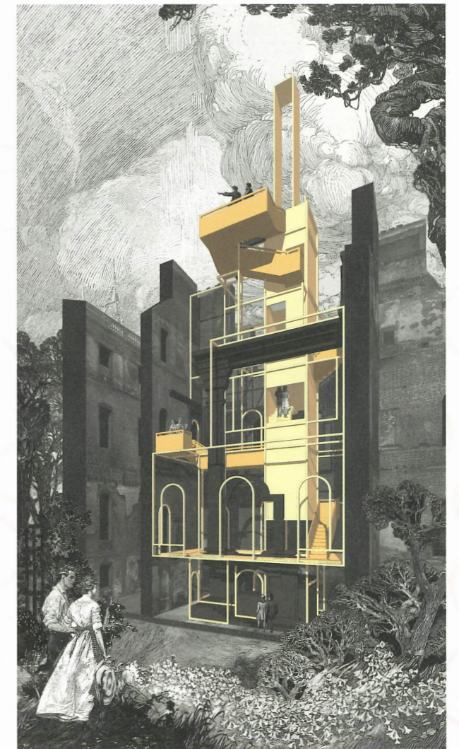
Fig. 3 Clandon Park: La réutilisation du bâtiment acquis par le National Trust, détruit par un incendie en 2015, projet qui s'inscrivait dans le programme de l'Interior Reuse Platform de 2018-2019. | Clandon Park: The reuse of the National Trust building ruined by fire in 2015. Project part of the Interior Reuse Platform work in 2018-19.