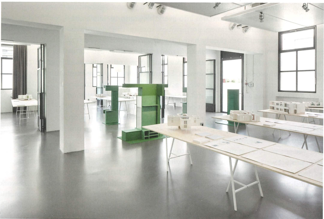
Fig. 6 Renouveler la ville depuis l'intérieur (To Renew the City from the Interior), 2019. Maître d'atelier | Studio tutor: Line Fontana; Assistant: Thierry Buache; Étudiants en architecture d'intérieur | students in Interior Architecture HEAD - Genève.

① Far - Forum d'architectures, Lausanne.