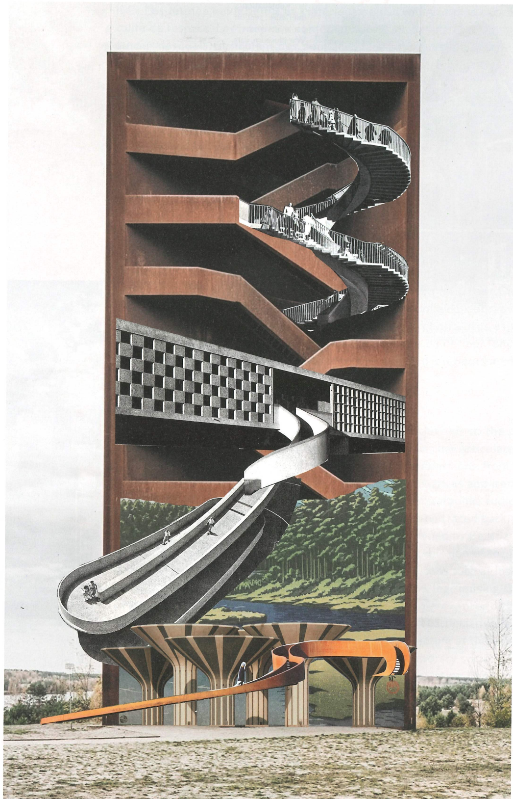
Fig. 4 Urbanisme intérieur: collage créé pour le 'Walking Directory', 2019-2020. | Interior Urbanism: Collage of the 'Walking Directory', 2019-20.