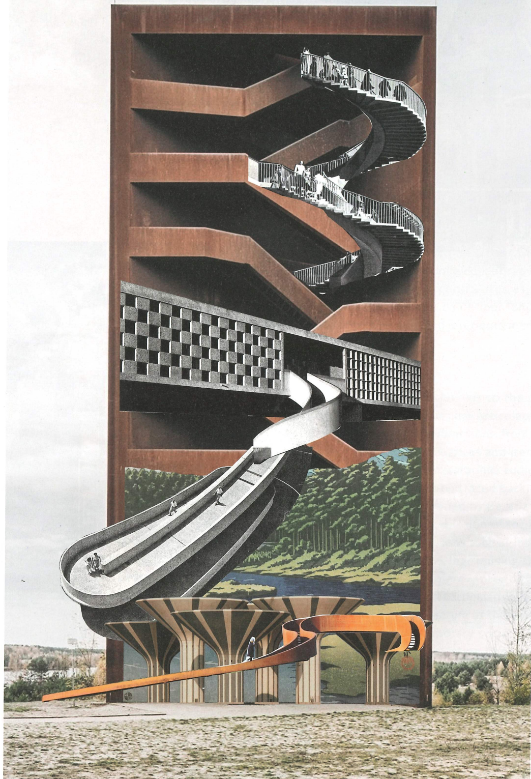
Fig. 4 Urbanisme intérieur: collage créé pour le 'Walking Directory', 2019-2020. | Interior Urbanism: Collage of the 'Walking Directory', 2019-20.