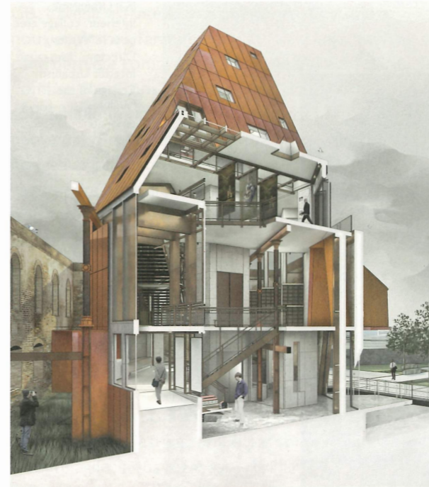
Fig. 2 Réutilisation intérieure: section par le Sheerness War Museum, vers les bastions et la mer, 2019-2020. | Interior Reuse: Section through Sheerness War Museum—to the bastions and sea, 2019-20.