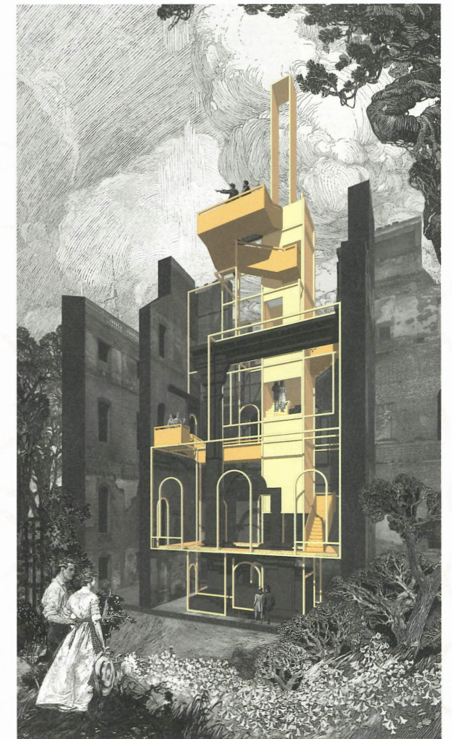
Fig. 3 Clandon Park: La réutilisation du bâtiment acquis par le National Trust, détruit par un incendie en 2015, projet qui s'inscrivait dans le programme de l'Interior Reuse Platform de 2018-2019. | Clandon Park: The reuse of the National Trust building ruined by fire in 2015. Project part of the Interior Reuse Platform work in 2018-19.