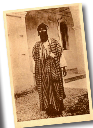
À gauche, la carte postale est légendée « Le Père de Foucauld et un Targui ». Comme en atteste cette autre carte, en haut, dont la vue a été prise le même jour et légendée au dos comme étant Ouksem....