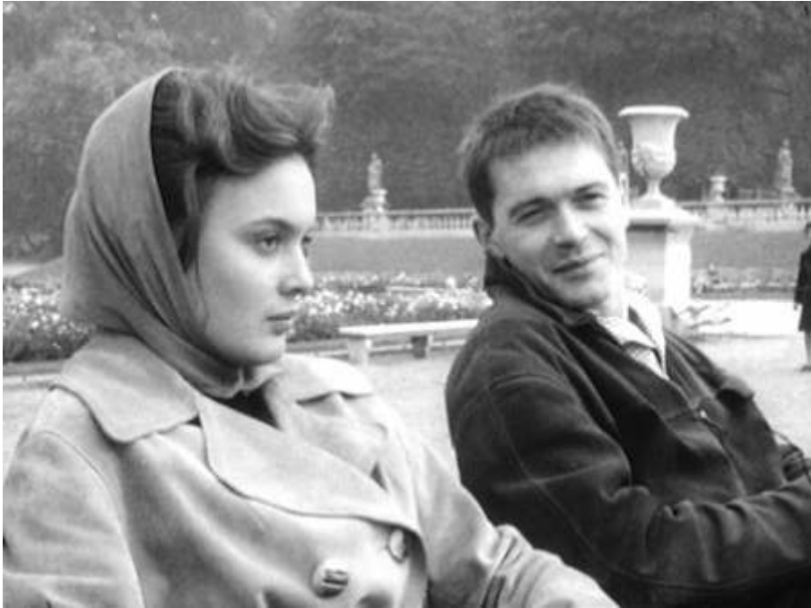
Photogramme extrait de La Punition , un film de Jean Rouch (1962), copie d'écran. Visionner un extrait du film La Punition .