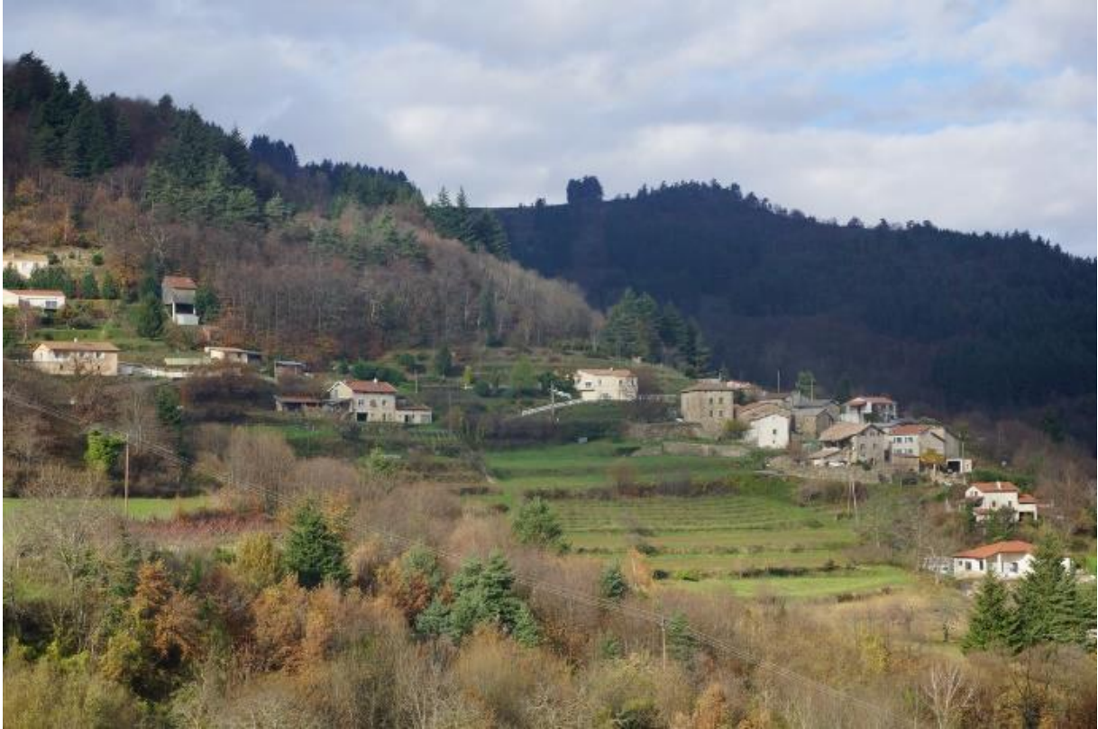
Extension péri rurale à Jaunac (07)