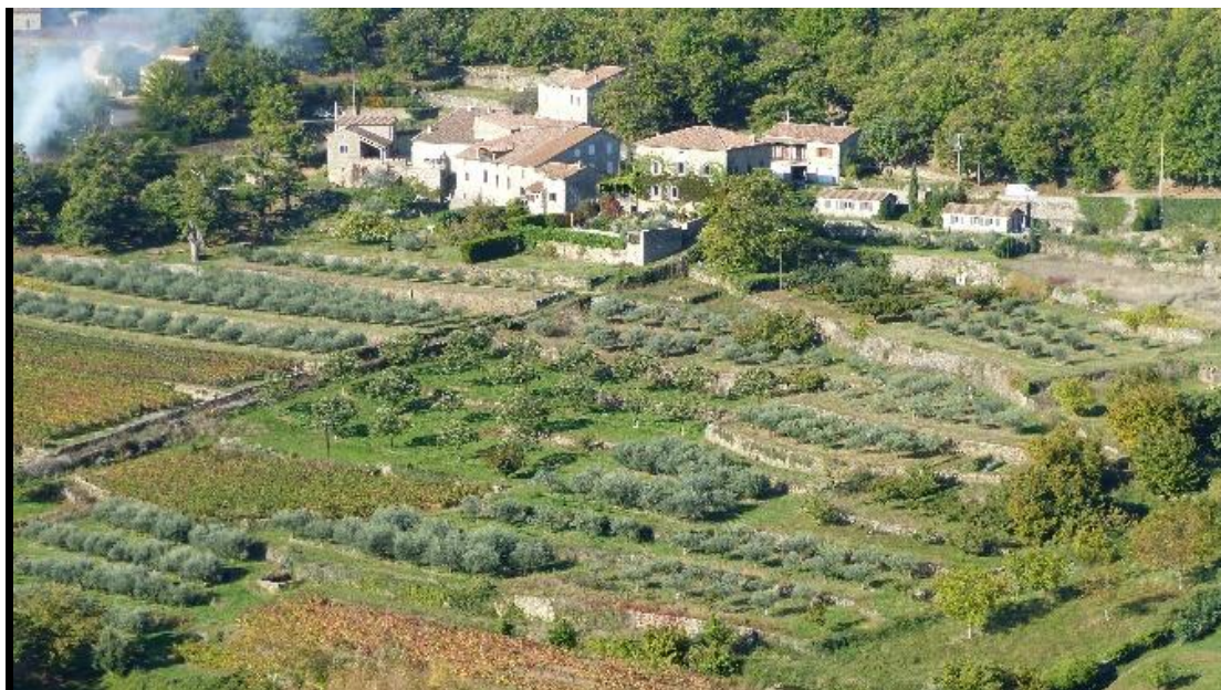
Terrasses et résidences secondaires à Vernon (07)