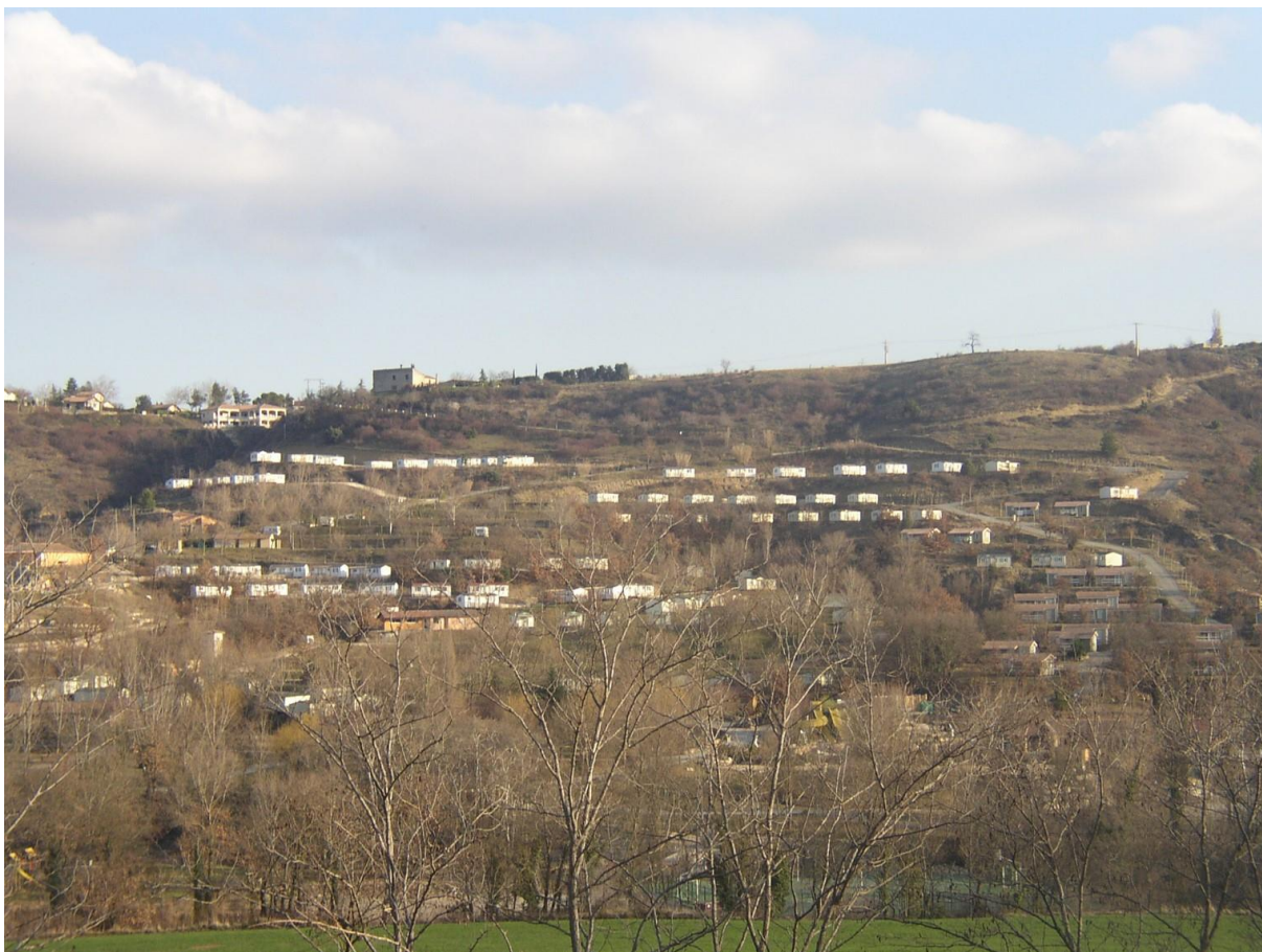
Camping du Pommier à Villeneuve de Berg (07)