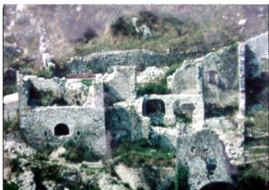
Le Viel Audon Balazuc (Ardèche) 1970

d'un lieu engagé aujourd'hui dans la transition agricole, alimentaire, énergétique et éducative. Cette perspective ouvre à de nouvelles recherches sur les trajectoires des paysages de terrasses des arrière-pays du pourtour de la méditerranée.