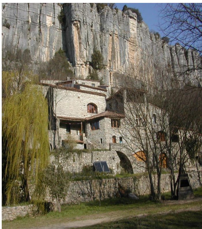
Le Viel Audon Balazuc (Ardèche) 2010