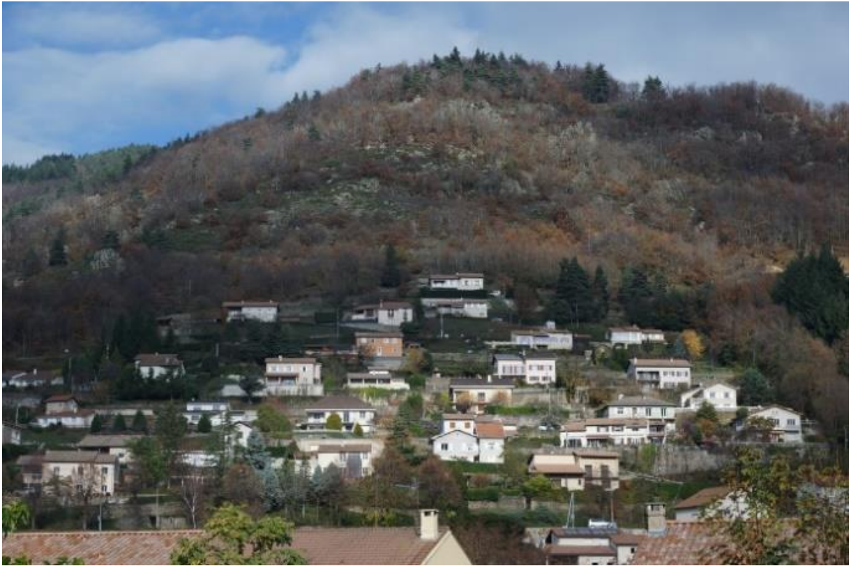
Extension périurbaine au Cheylard (07)