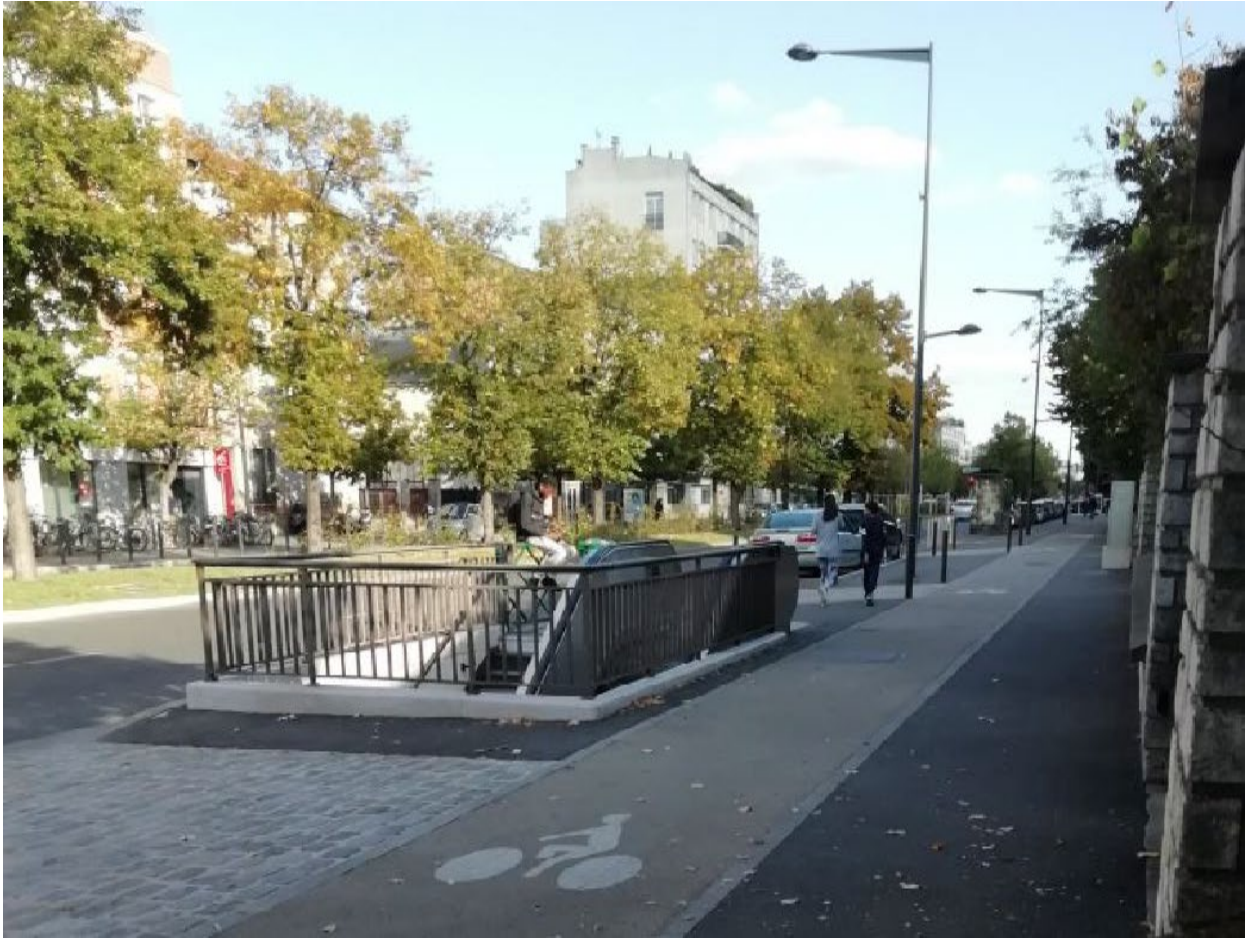
Figure 2 : Avenue du Général Leclerc Maisons Alfort (RD19), octobre 2019 : un trottoir généreux, récemment aménagé, où la bande cyclable s'intercale entre la bouche du métro Maisons Alfort Stade et une bande piétonne obstruée un peu plus loin par un mobilier urbain