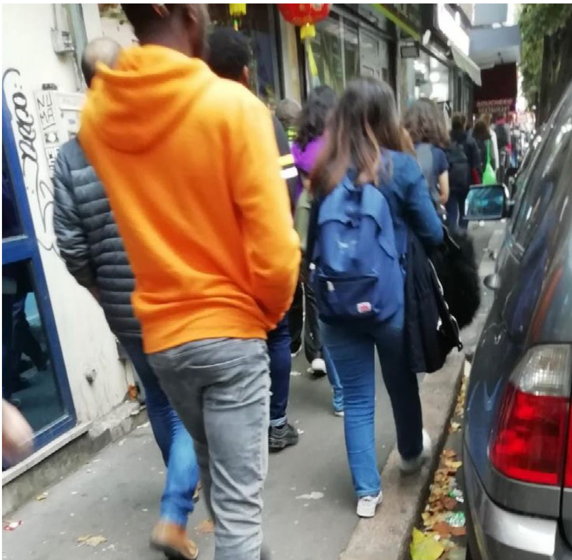
Figure 1 : Rue Paul Vaillant-Couturier, Vitry sur Seine (RD155), septembre-octobre 2019 : un fort trafic piéton, ici de collégiens, dans des conditions inconfortables

La meilleure connaissance du fonctionnement des flux et des activités pédestres doit aider à déterminer plus précisément l'emprise au sol, c'est-à-dire la place qu'il convient de donner à la marche dans l'espace limité de la rue. Cela ne réduira pas l'importance des arbitrages politiques concernant le partage de la voirie entre les différents modes de transport d'une part, et la répartition dans le temps ou dans l'espace de différents usages pédestres, d'autre part. Mais ces décisions pourraient être prises selon des critères non seulement plus scientifiques car plus précis sur les enjeux et les implications, mais aussi plus démocratiques grâce à la prise en compte de la diversité des usages, qui dépasse celle des usagers qu'on peut mobiliser dans les démarches participatives.