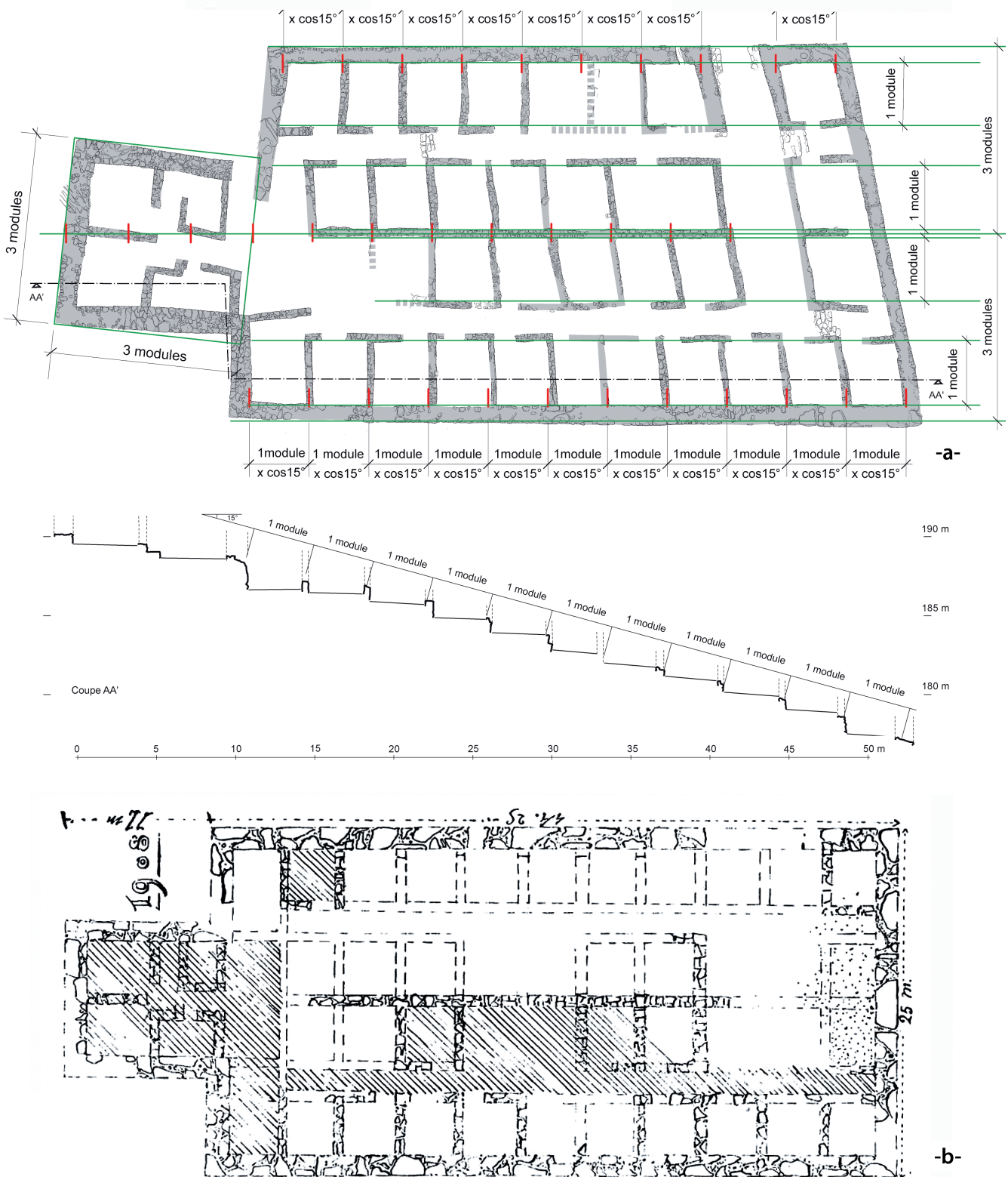
Fig. 1. Marseille, le Verduron (Marseille, Bouches-du-Rhône). a. Analyse modulaire en plan et en coupe (Badie & Bernard 2008). b. Croquis coté par S. Clastrier (Clastrier 1909).