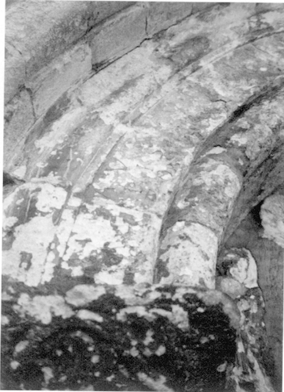
FIG. 3. – Détail de la première archivolt : inscription sur trois lignes.