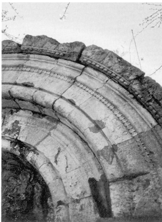
FIG. 5. – Détail de la seconde archivolte, côté droit.

Les premiers exemples d'une représentation du Christ marchant sur les quatre animaux du psaume 91 se trouvent sur des sarcophages espagnols du IV e siècle. On a pensé que le tympan de l'Île-Barbe aurait son inspiration dans une miniature du XI e siècle d'un manuscrit d'Ensiedeln, où le Christ foulant aux pieds le lion et le dragon est entouré de deux petits personnages, Heto et Adelheit (les copistes ?) qui reçoivent sa bénédiction 9 . Et il est vrai qu'au tympan de l'Île-Barbe on distingue encore bien, à côté de chaque ange, un petit personnage agenouillé, sans doute ici des moines. Le verset 14 du psaume 91 (90) est d'ailleurs inscrit auprès du Christ dans le manuscrit d'Ensiedeln.