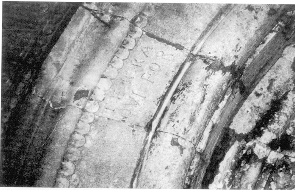
FIG. 4. – Détail de la seconde archivolt, côté gauche.