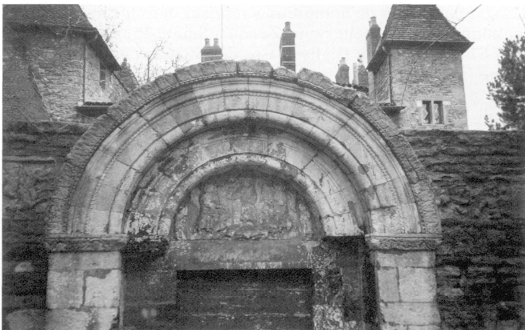
FIG. 2. – Le tympan roman.