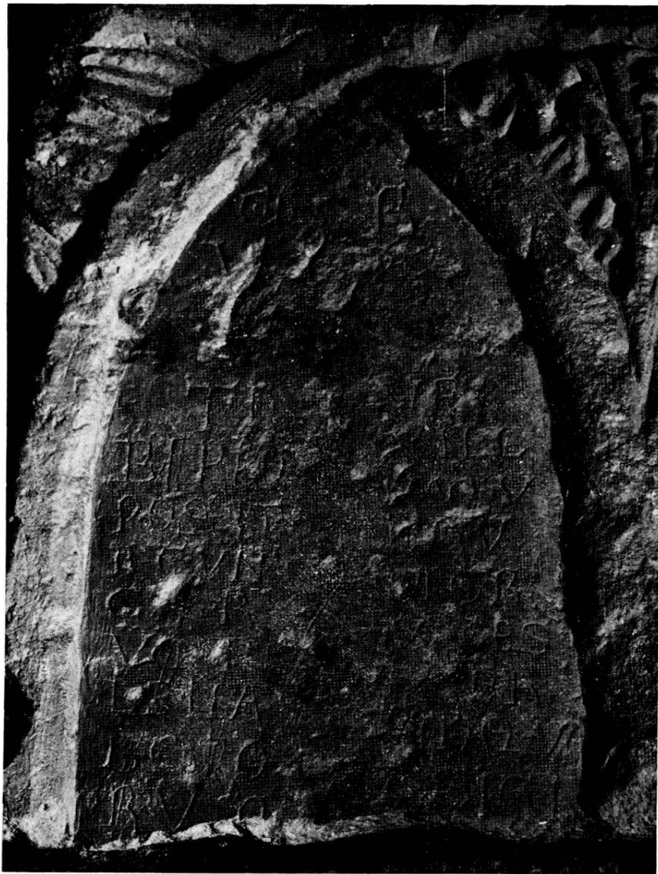
Fig. 7. - Id. Fragment d'autel (?). Première partie.

Illustration non autorisée à la diffusion