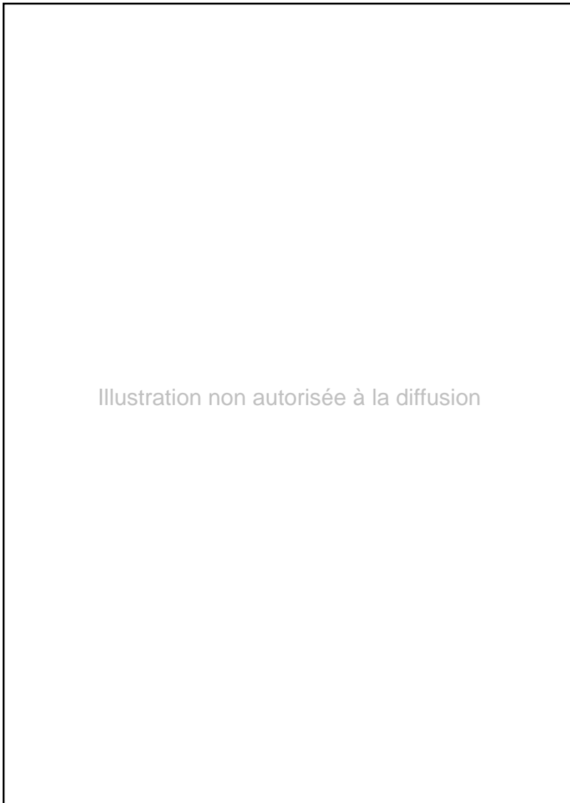
Fig. 10. SAINT-SAVIN-SUR-GARTEMPE (Vienne). Nef. Mur nord. Tables de la Loi.

Illustration non autorisée à la diffusion