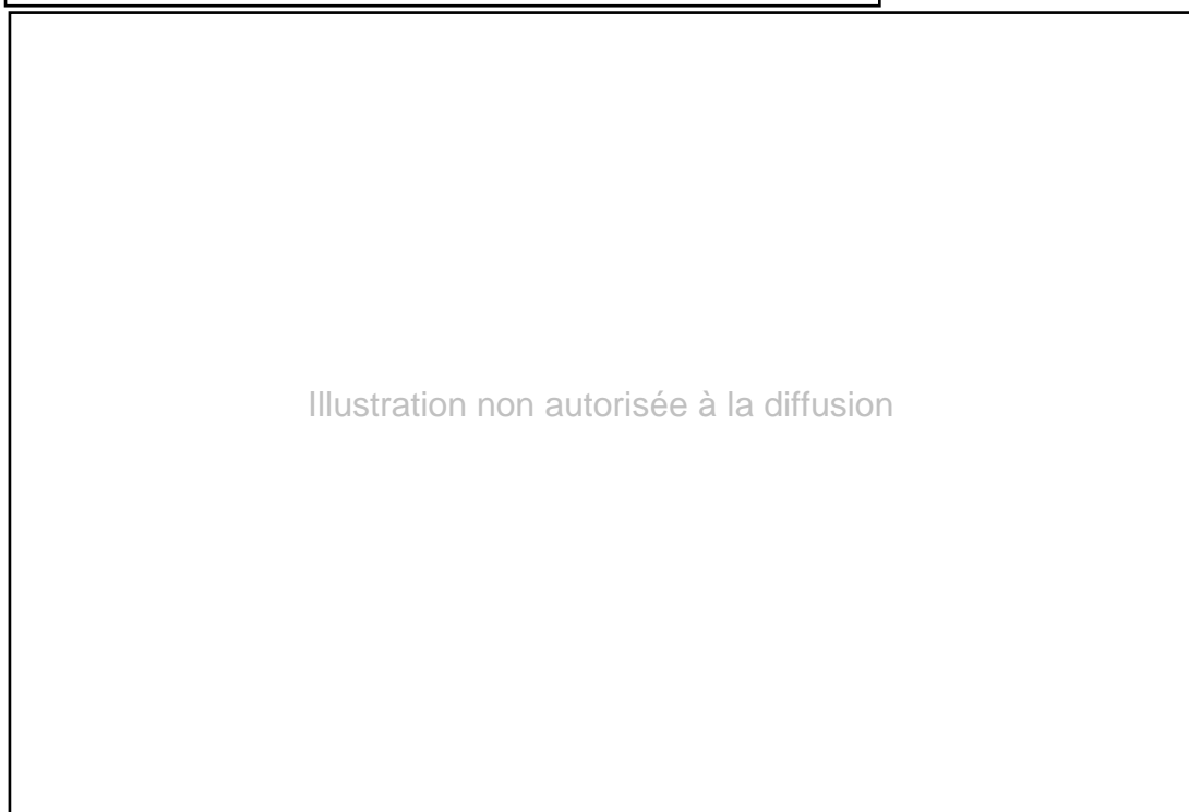
Illustration non autorisée à la diffusion