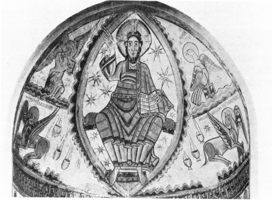
Saint-Martin de Fenollar, c ne de Maureillas

( Corpus des inscriptions de la France médiévale. 11. Pyrénées-Orientales , éd. R. FAVREAU, J. MICHAUD, B. MORA, Paris, 1986, n° 74, p. 91, cl. J. MICHAUD).