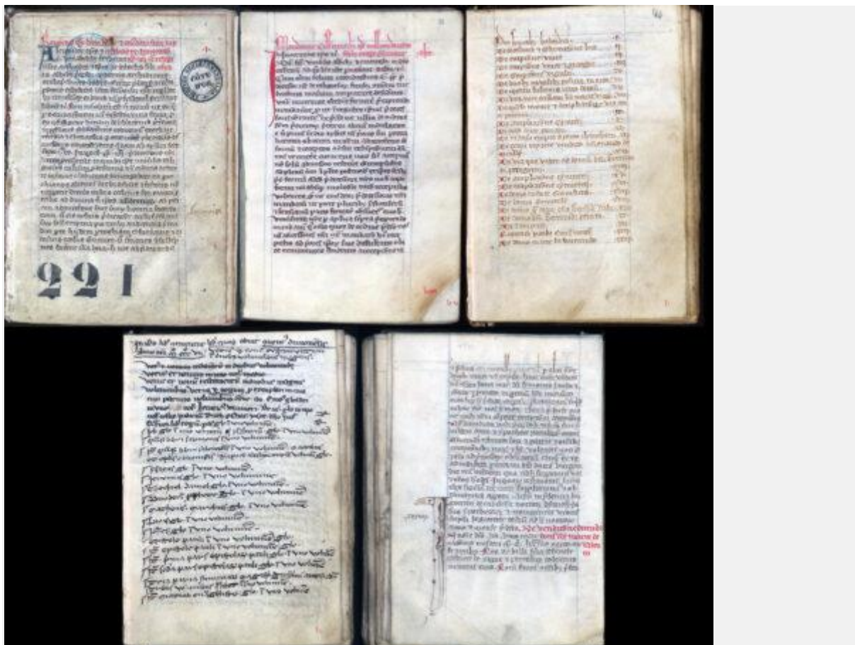
Cartulaire des dominicains de Dijon (c. 1286). Dijon, ADCO 21, f. 1r, 28r, 144r, 145r, 173v.