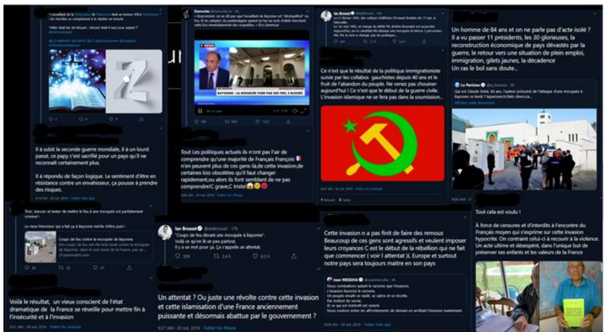
Figure 9 Les tweets de légitimation de l'attentat

Cet appel à la mobilisation est actualisé lors de l'attentat de Bayonne du 28 octobre 2019. Nous souhaitons nous intéresser aux évaluations qui convoquent « implicitement ou explicitement un système de normes et de valeurs » (Jackiewicz : 31) pour juger l'acte perpétré par cet ancien candidat FN.