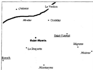
Les possessions de Saint-Maurice au XIV e siècle