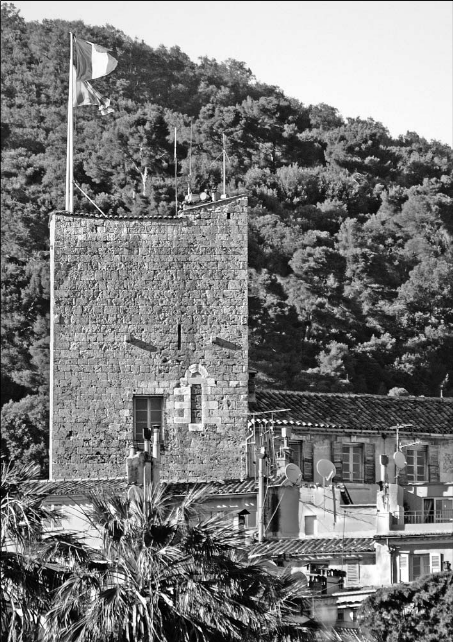
Fig. 54. Tour du Puy, élévation méridionale.