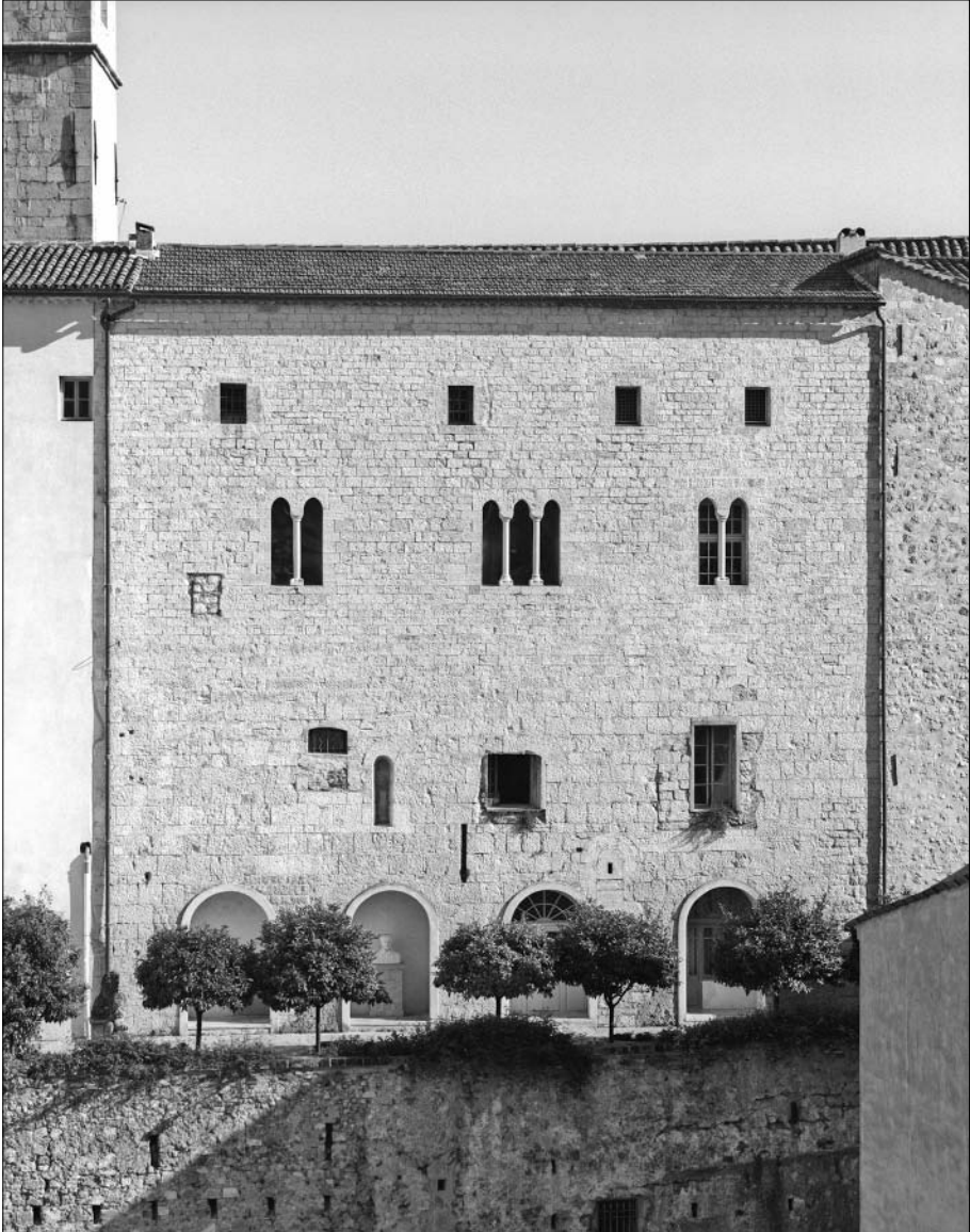
Fig. 53. Palais épiscopal, élévation septentrionale (après restauration de la fenêtre géminée occidentale). Photo Alain Sabatier, 1997.