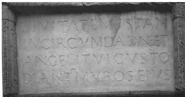
Fig. 5. Abbatale de Corvey (Suisse), inscription de la façade de l'antéglise.