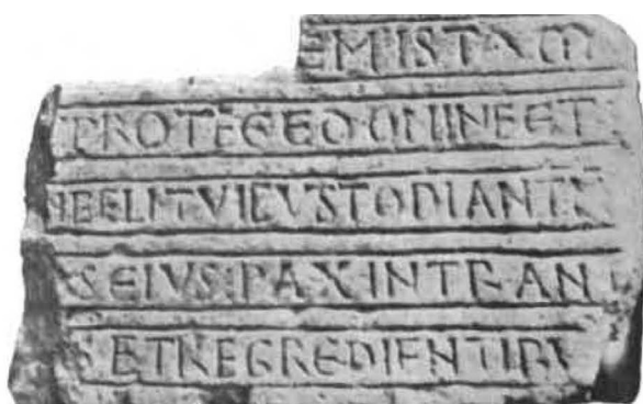
Fig. 6. Limoges, Musée municipal, inscription trouvée à l'emplacement de l'abbaye Saint-Augustin. ( Guide du musée municipal. Collection archéologique , Limoges, 1969, p. 122, n° 265)

Les onciales sont plus nombreuses qu'à la collégiale du Dorat, mais la présence d'un C carré et d'un G carré ferait pencher pour une date un peu antérieure (XI e siècle).