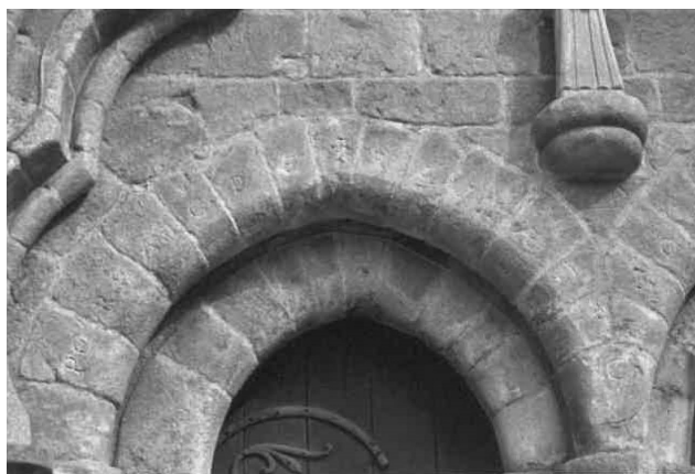
Fig. 9. L'inscription de la façade occidentale de la collégiale du Dorat, porte de gauche.

[SV]PER HANC PETRAM AEDIFICABO ECCLESIAM MEAM « Sur cette pierre je bâtirai mon église »