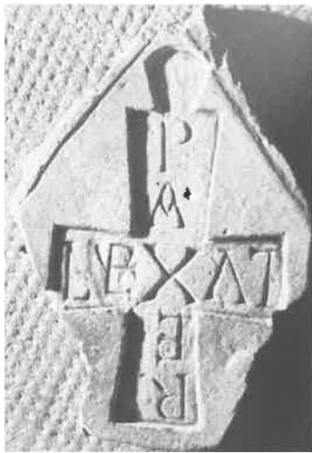
Fig. 2. Moule d'une croix dans la tombe d'un pèlerin (XII e s.). Pégriueux, Musée municipal

On rencontre encore cet emploi de mots de trois lettres terminés par un X dans les très nombreux chrismes de la région pyrénéenne. Six d'entre eux comportent, outre le chrisme et l'alfa et l'oméga, les mots REX, LEX, LVX, PAX. Ces monosyllabes sont ajoutés au chrisme à Simacourbe (Pyrénées-Atlantiques), PAX et LVX en haut, REX et LEX en bas, et au chrisme de Larreule (Hautes-Pyrénées), PAX et REX en haut, LVX et LEX en bas 49 . Dans trois autres cas le X du chrisme est utilisé pour former une des branches du X de REX (en haut à droite) et de LEX (en bas à droite), les mots PAX et LVX, à gauche, étant gravés en entier : Lème (Pyrénées-Atlantiques), Bostens (fig. 3) et Saint-Avit (Landes) 50 . Le dernier chrisme, à Séron (Pyrénées-Atlantiques), a PAX et LVX à droite, mais à gauche une gravure désordonnée de REX et LEX, le X du chrisme servant de dernière lettre 51 . On peut encore signaler l'adjonction de REX, LEX, LVX à trois autres chrismes pyrénéens : Castillon-Debats et Peyrusse-Grand dans le Gers, Montaner dans les Pyrénées-Atlantiques 52 . Curieusement l'emploi des quatre monosyllabes ne se rencontre pas en Navarre et en Aragon .