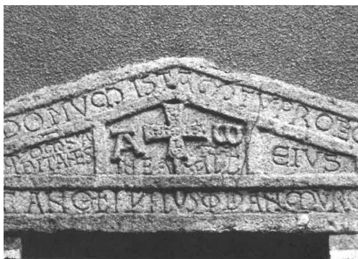
Fig. 8. Le Dorat, linteau en bâtière conservé au couvent des Carmélites.