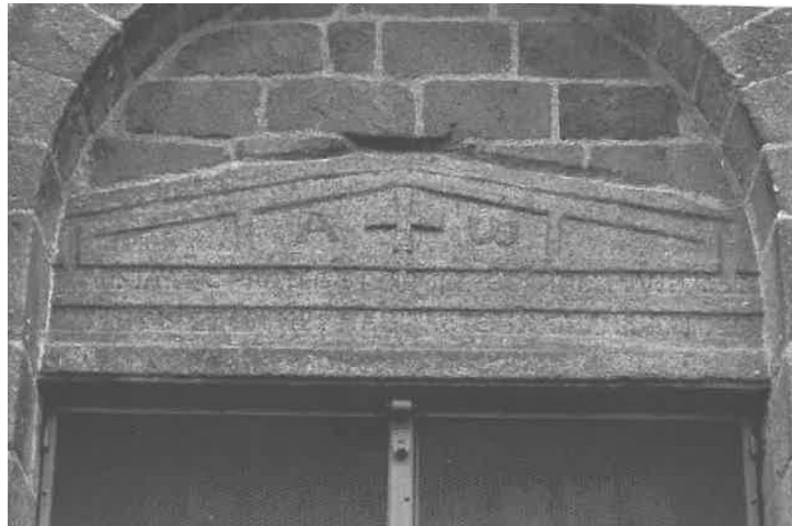
Fig. 4. Linteau de la porte nord de la collégiale du Dorat.

peu d'oncials (5 E sur 11), les Mont des jambages écartés, il n'y a pas de plateau supérieur ni de transversale brisée dans les A. L'écriture peut reporter à la fin du XI e ou au début du XII e siècle (fig. 4).