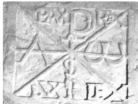
Fig. 3. Eglise Saint-Orens de Bostens (Landes), chrisme. (Cl. CESCO, J. Michaud)

Sous la croix flanquée de l'alpha et de l'oméga et comportant les mots REX, LEX, LVX, PAX, on peut lire au linteau de la porte nord de Saint-Pierre du Dorat :