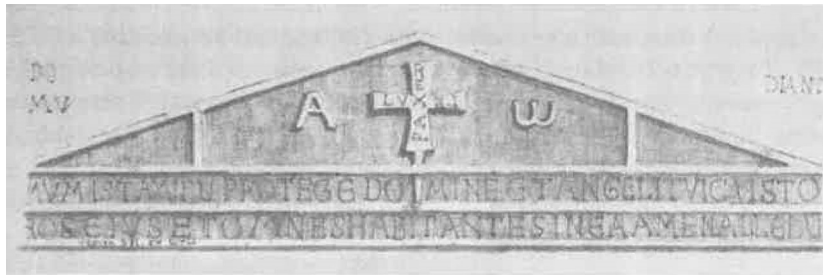
Fig. 1. L'inscription de la porte nord de la collégiale du Dorat. Relevé de l'abbé Texier, Manuel d'épigraphie , 1852, pl. 8, n° 1, b.-t.

DOMVM ISTAM TV PROTEGE DOMINE : ET ANGELI CUSTODIANT MVROS EIUS : ET OMNES HABITANTES IN EA AMEN ALLELVIA « Seigneur, toi, protège cette maison, et que tes anges gardent ses murs et tous ceux qui y habitent. Amen. Alleluia » (fig. 1)