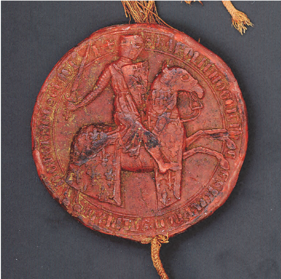
Fig. 1/a. Sceau de Charles, prince de Salerno, 9 mars 1281 (AD13, B 377).