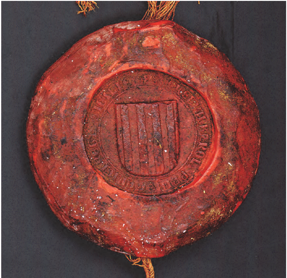
Fig. 1/b. Sceau de Charles, prince de Salerno, 9 mars 1281 (AD13, B 377).