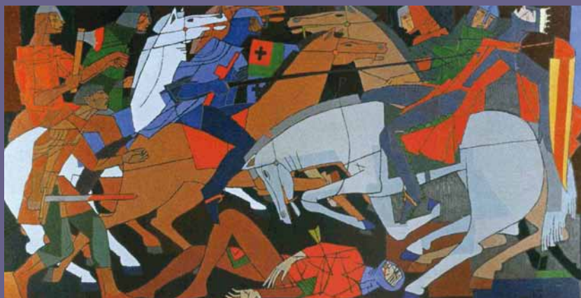
La bataille de Muret, Jacques Fauché, 1960, huile sur bois, Association pour le Souvenir de Jean-Baptiste Doumeng, dépôt musée Clément Ader-Muret.

La Fédération historique de Midi-Pyrénées, la Société des Études du Comminges et la Société du Patrimoine du Muretain ont collaboré pour que se tienne à Muret les 13 et 14 septembre 2013 un congrès réunissant une quarantaine de savants et d'érudits passionnés par cet événement et par l'époque dans laquelle il s'est déroulé. La présente publication se propose d'offrir au lecteur une synthèse renouvelée de ce qui fut un moment capital et un temps essentiel, non seulement dans l'histoire des pays du Midi de part et d'autre des Pyrénées, mais aussi pour le royaume de France et sa construction territoriale.