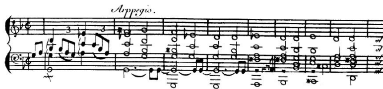
Michel Corrette, 1er Livre de Pièces pour le clavecin, Paris, L'Auteur, Boivin, Le Clerc, 1734, p. 1

A l'époque de l' Encyclopédie , où l'on publie moins de préludes qu'au siècle précédent, le 4 e paragraphe d'HARPEGEMENT, qui complète l'article PRÉLUDER, ( Musique. ) (t. XIII, 1765, p. 287a) de Rousseau, témoigne que la pratique des préludes improvisés est encore bien vivante, particulièrement chez les instrumentistes à clavier.