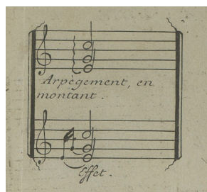
François Couperin, extrait de la table des agréments des Pièces de clavecin (1713)

Depuis le XVII e siècle, l'harpègement (ou « arpègement » ou encore « harpégé ») est aussi présenté dans les tables des agréments des livres de clavecin français. Ainsi dans celle premier livre de Pièces de clavecin de François Couperin (Paris, l'Auteur, Foucaut, 1713, p. 75) :