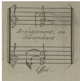
François Couperin, op. cit.

Les clavecinistes distinguent aussi les harpègements simples des harpègements figurés (dans lesquels on emprunte d'autres notes que celles de l'accord, comme dans l'exemple de Rameau ci-dessous). L'article HARPEGEMENT n'entre pas dans le détail, et en reste à une définition de l'harpègement simple.