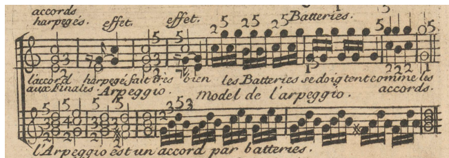
Michel Corrette, Les Amusemens du Parnasse, Paris, L'Auteur, Boivin, Le Clerc, 1749, p. F

Plus tard dans le siècle, certains compositeurs ajoutent des exemples d' arpeggio italien. Ainsi Michel Corrette, dans Les Amusemens du Parnasse. Méthode courte et facile pour apprendre à toucher le clavecin (Paris, L'Auteur, Boivin, Le Clerc, 1739), distingue « l'accord harpégé » qui « fait très bien aux finales » de « l'arpeggio » qui est « un accord par batteries » (p. F) :