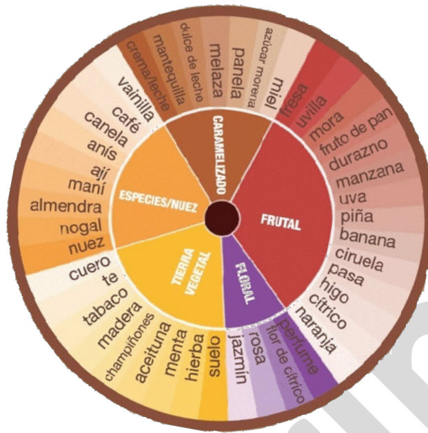
FIG. 1 – Carte des saveurs du cacao d'Équateur. Modèle suggéré pour notre pays. (ANECACAO, 2013- www.anecacao.com , le titre de la figure est la traduction française de la légende en espagnol-source).

En écho au concept d'équilibre entre complexité et simplicité énoncé par Gleick (1989) 5 , il semble que l'équilibre proposé par les experts ne satisfasse que peu les besoins en communication des consommateurs, que ce soit de par sa faible faculté à reproduire la réalité ou de par sa trop forte complexité. En effet, au travers d'une émotion sémiotisée par le dit , le montré , et l' étayé , au sens de Micheli (2014 : 9-10), les consommateurs priorisent un « discours hédonique au service d'une émotion dont le partage est aussi source d'émotion [...] contrairement à l'expert [dont] le discours [...] suit une structure catégorielle basée sur les théories des prototypes » (Méric 2019) 6 . Cette réalité ouvre de nouvelles perspectives de recherche sur l'origine même du terme technique sensé qualifier l'émotion de dégustation : doit-il rester une création d'experts comme avec les panels en analyse sensorielle, ou peut-il naître de formes alternatives qui prennent en compte les discours authentiques des acteurs impliqués dans la chaîne de fabrication du chocolat ainsi que les discours du consommateur ? Entre d'autres termes, quelle corrélation existe-t-il entre les discours constitutifs du cacao – tous les discours : multiples et hétérogènes, du producteur au consommateur – et le terme technique normalisé de l'expert ? Nous suivons ici Dubois (2017 : 11) qui insiste sur la multiplicité des discours à prendre en compte dans le domaine sensoriel pour arriver à embrasser la