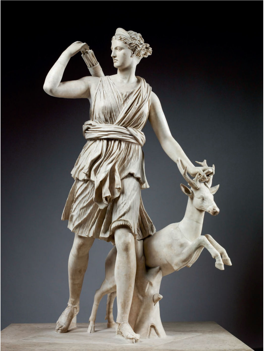
Tav. 1. Artemide cacciatrice, detta «Diana di Versailles», marmo, II sec. d.C., copia romana da un originale greco del IV sec. a.C. Parigi, Musée du Louvre.