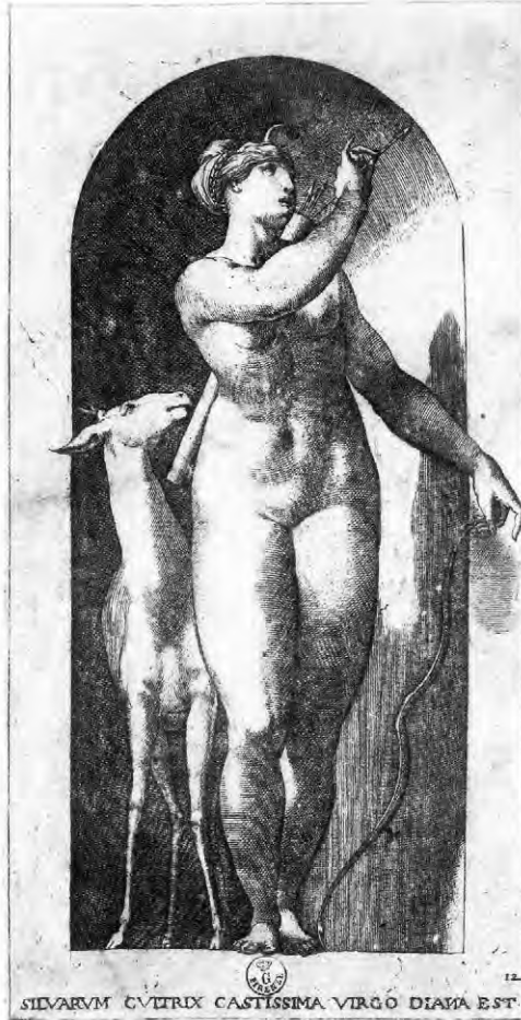
Fig. 2. Giovanni Jacopo Caraglio, d'après Rosso Fiorentino, Diane , gravure, 1526, pour la série des Dieux dans les niches .