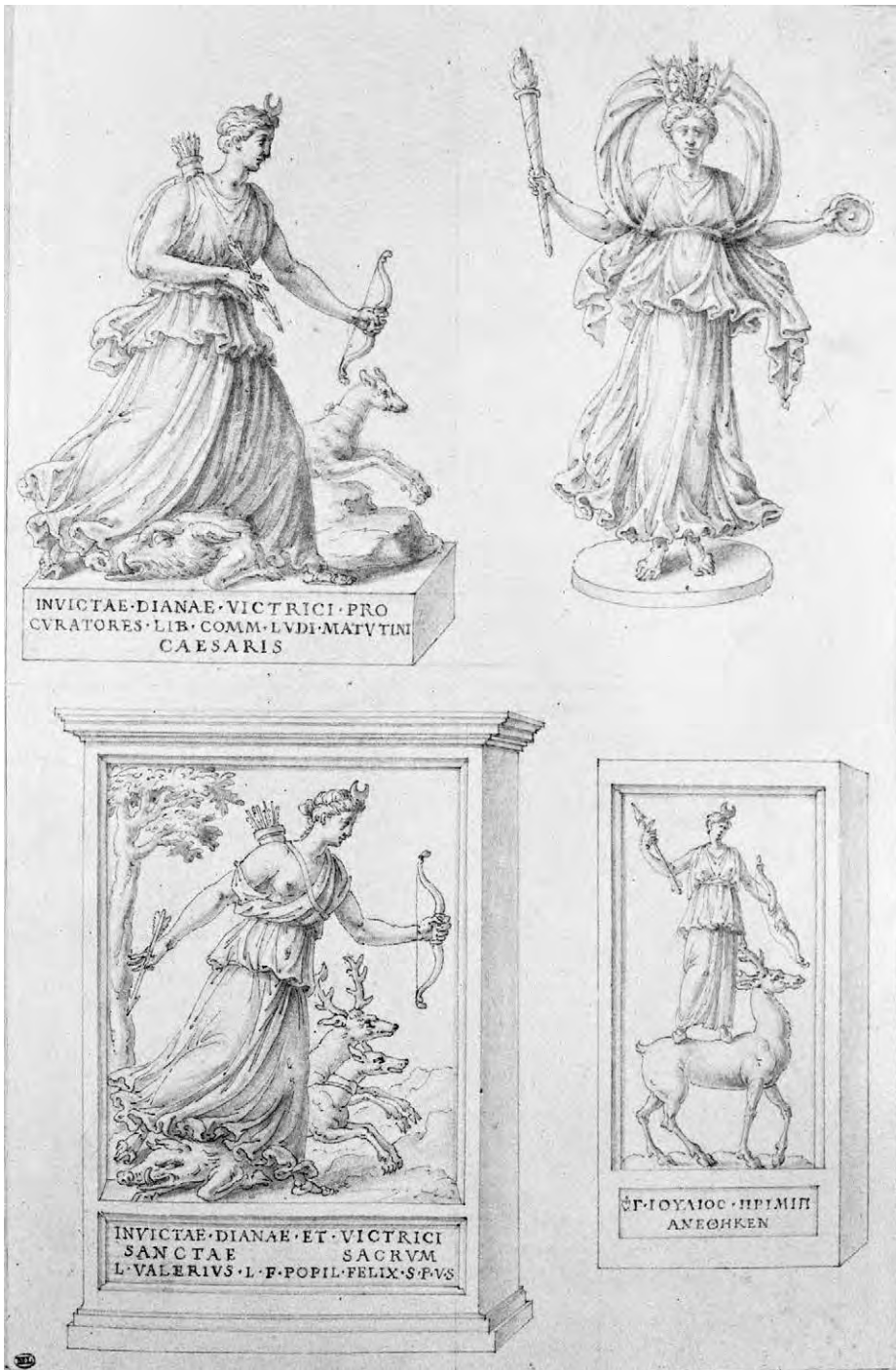
Fig. 1. Étienne Dupérac (d'après Pirro Ligorio), Un Groupe, une statue et deux monuments avec des bas-reliefs représentant Diane , dessin, 1575 (?). Paris, Musée du Louvre.