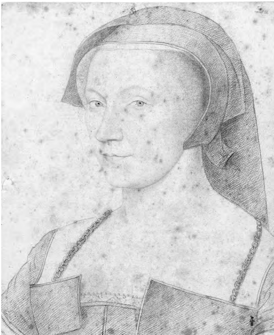
Fig. 4. François Clouet, Portrait en buste de Diane de Poitiers, duchesse de Valentinois , dessin au crayon noir, sanguine, vers 1540, entre 1550 et 1555. Chantilly, Musée Condé.