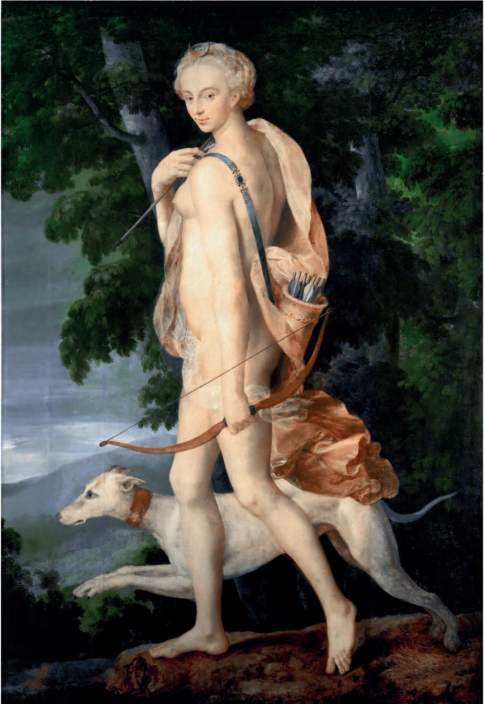
Tav. 21. Pittore attivo in Francia, Diana cacciatrice , olio su tavola trasportato su tela, 1550-1560 circa. Parigi, Musée du Louvre.