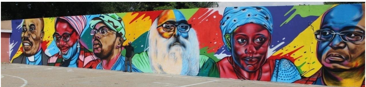
Le Mur de la Citoyenneté a été réalisé par des activistes locaux à Cazenga, un município situé à environ 5 km du centre-ville de Luanda. Photo : Hitler Samussuku, janvier 2021.

Le 2 janvier 2021, une fresque murale peinte sur les murs d'un espace communautaire à Cazenga 1 a été vandalisée. La fresque est une initiative d'un groupe d'activistes qui utilise cet espace depuis 2011. Ils s'y retrouvent pour lancer des albums de musique, organiser des concours de graffiti et plus généralement pour affirmer leur identité collective dans un contexte où le parti au pouvoir domine tous les échelons du gouvernement et exerce une pression sociale pour empêcher l'expression de voix alternatives. Au fil des ans, le mur a donc été peint à plusieurs reprises mais depuis 2020, la fresque représente les visages d'Angolais et d'Angolaises connus pour leur rôle dans la défense des droits humains, d'où son surnom de « Mur de la Citoyenneté », un nom qui suggère l'agenda vindicatif de ses auteurs. Son effacement partiel a donc été interprété par les activistes comme une attaque politique, et ce d'autant plus que les dommages ont été causés précisément au moment où un nouvel administrateur municipal – nommé parmi les cadres du parti au pouvoir – prenait ses fonctions à Cazenga.