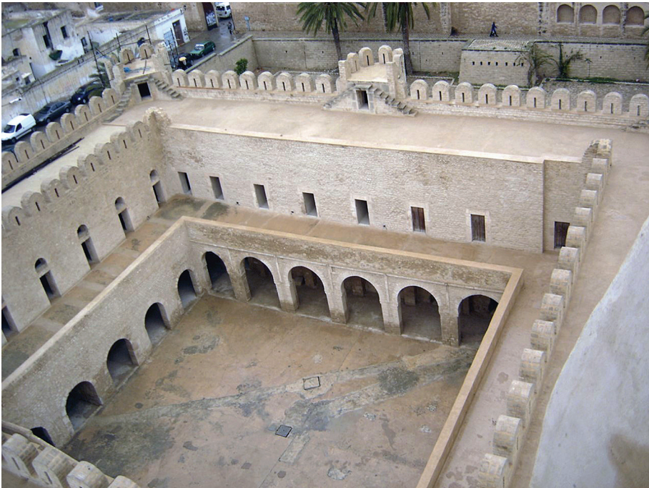
Fig. 3 - Ribat de Sousse, vue de l'intérieur