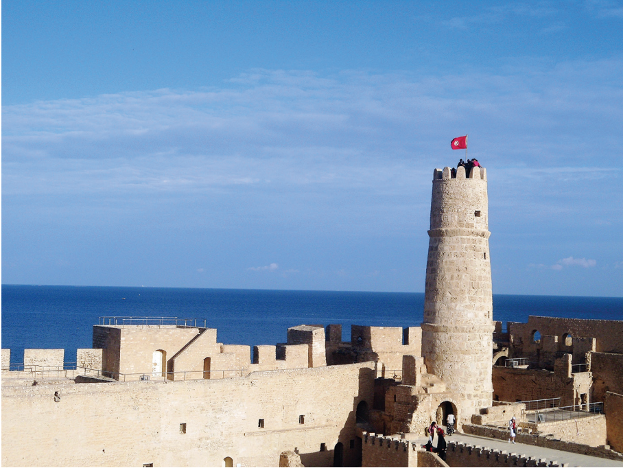
Fig. 2 - Ribât de Monastir, vue sur la mer