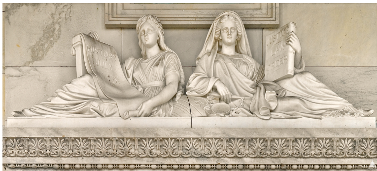
Thomas Crawford, Justice and History, early 1860s. Senate Wing, East Front, U.S. Capitol ( http://www.aoc.gov/art/other-sculpture/justice-and-history-sculpture )

Tu as raison. Il y a un autre verbe auquel je regrette de n'avoir pas songé, "achever", qui a le double sens de "mettre fin à", et de "compléter".