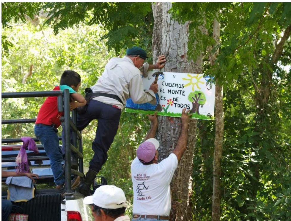
Figure 3. Sortie collective dans la forêt de Chocholá. Des habitants accrochent des pancartes avec des messages tels que « prenons soin du monte , il appartient à tout le monde » sur les principaux chemins de l' ejido (Chocholá, le 30/09/2018).

point de vue de la transformation et la distribution des droits d'accès aux ressources du territoire et à ses instances politiques.