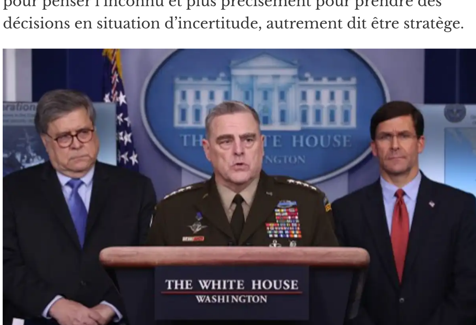
Explications sur la mobilisation militaire face au Covid-19 à la Maison Blanche.

Plus récemment l'armée américaine, confrontée à un changement profond de son environnement à la fin du XX e siècle (fin de la guerre froide, opérations de maintien de la paix, terrorisme international, etc.) a dû revoir profondément sa doctrine. Les attaques terroristes du 11 septembre et les guerres d'Afghanistan et d'Irak ont renforcé la nécessité d'avoir des outils pour penser l'inconnu et plus précisément pour prendre des décisions en situation d'incertitude, autrement dit être stratège.