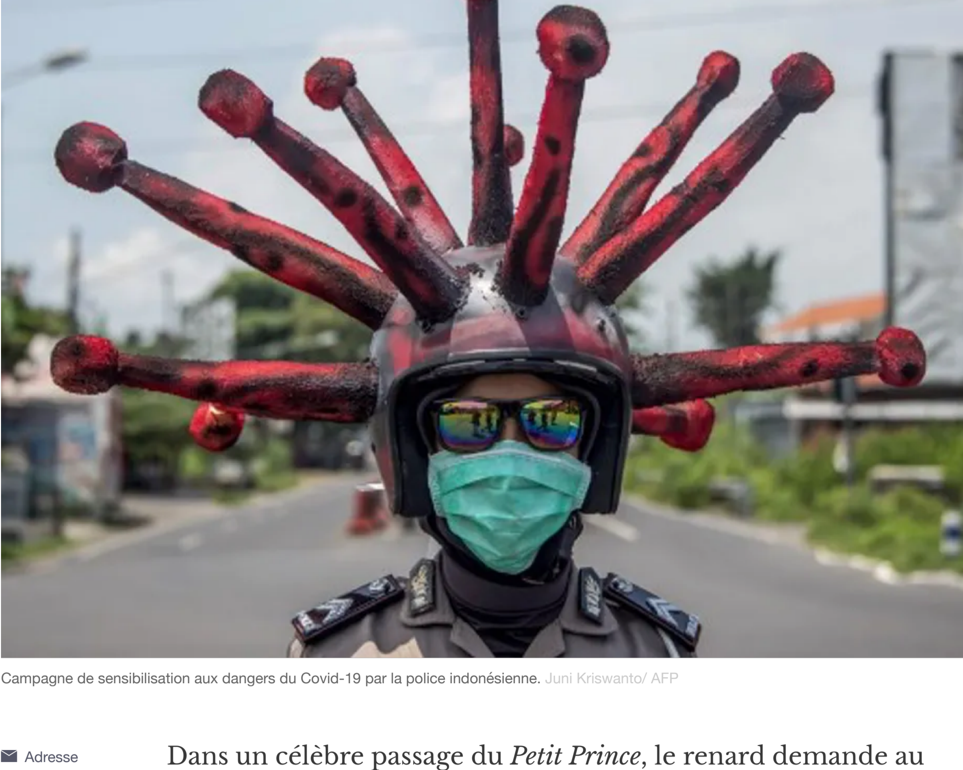
Campagne de sensibilisation aux dangers du Covid-19 par la police indonésienne.