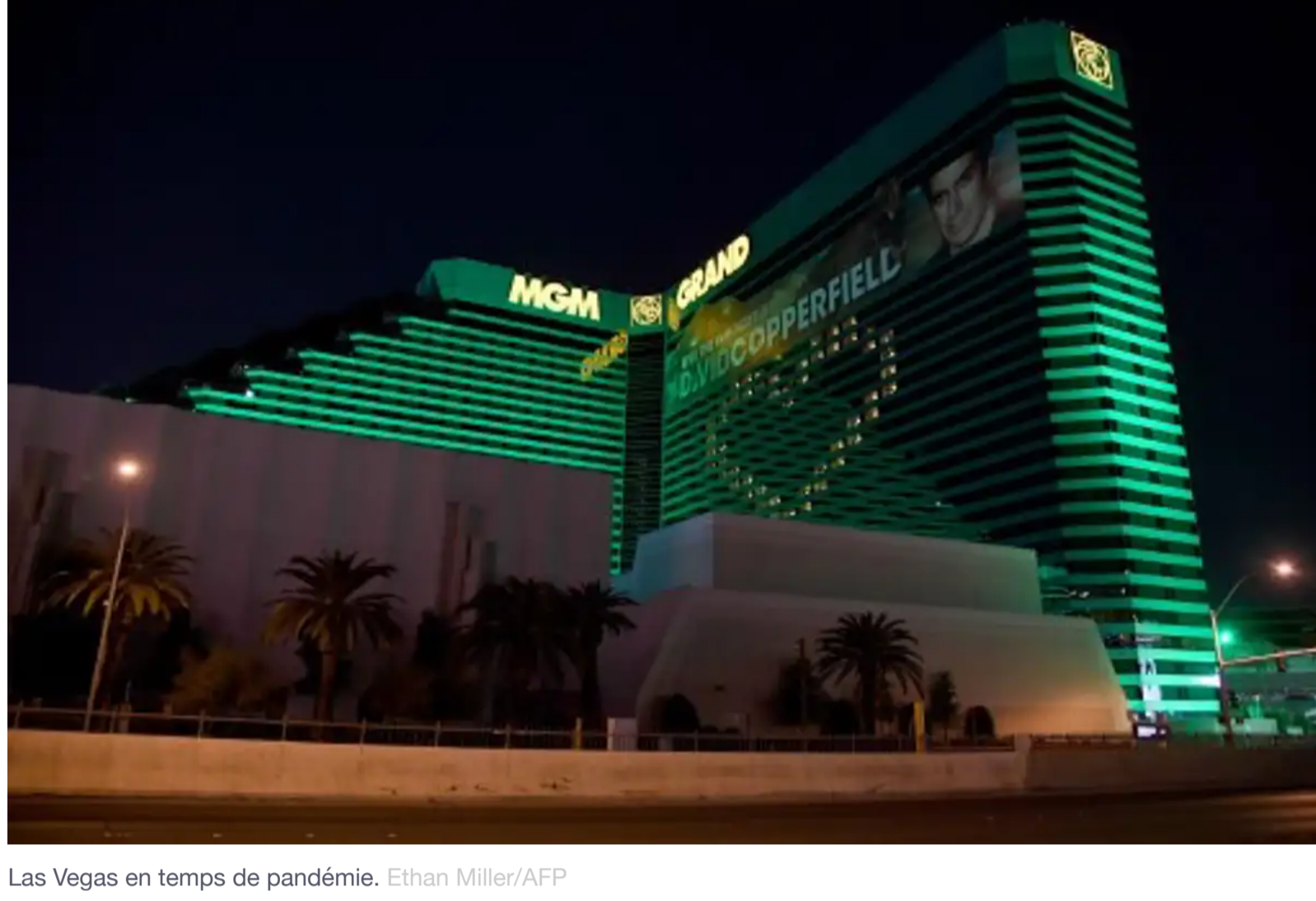
Las Vegas en temps de pandémie.

La dimension ludique fait référence aux casinos. Ces établissements gagnent de l'argent car le hasard est sous contrôle : le tirage d'un nombre à la roulette, ou la combinaison de cartes d'une main de black jack suivent les lois Laplace-Gauss, toutes choses étant égales par ailleurs. Or le contrôle des probabilités n'est possible dans un casino que parce que c'est un espace clos et très réglementé, tout le contraire du monde dans lequel nous vivons.