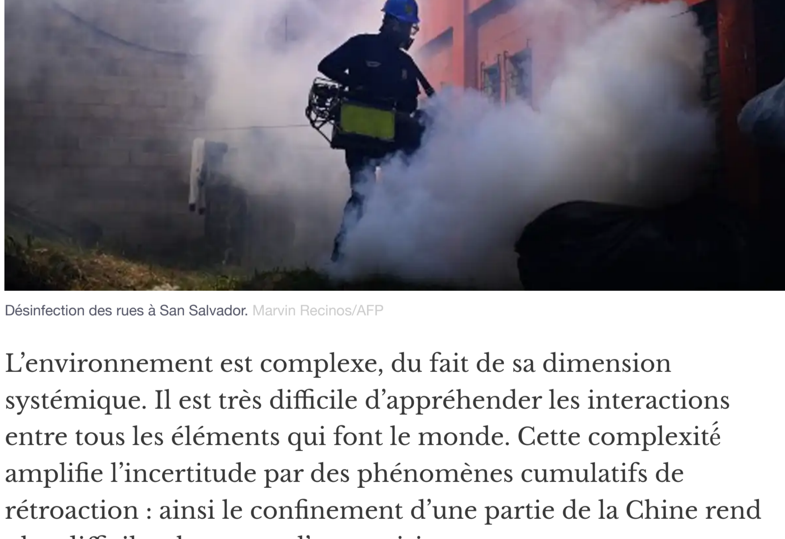
Désinfection des rues à San Salvador.

Dès lors, l'incertitude se combat par la compréhension de l'environnement, une compréhension qui se nourrit de points de vue multiples et contradictoires (comme c'est souvent le cas dans la communauté scientifique par exemple) car l'inverse d'une bonne idée peut aussi être une bonne idée (traiter et ne pas traiter les patients à la chloroquine sont deux idées contradictoires, toutes les deux valides dans un contexte d'incertitude).