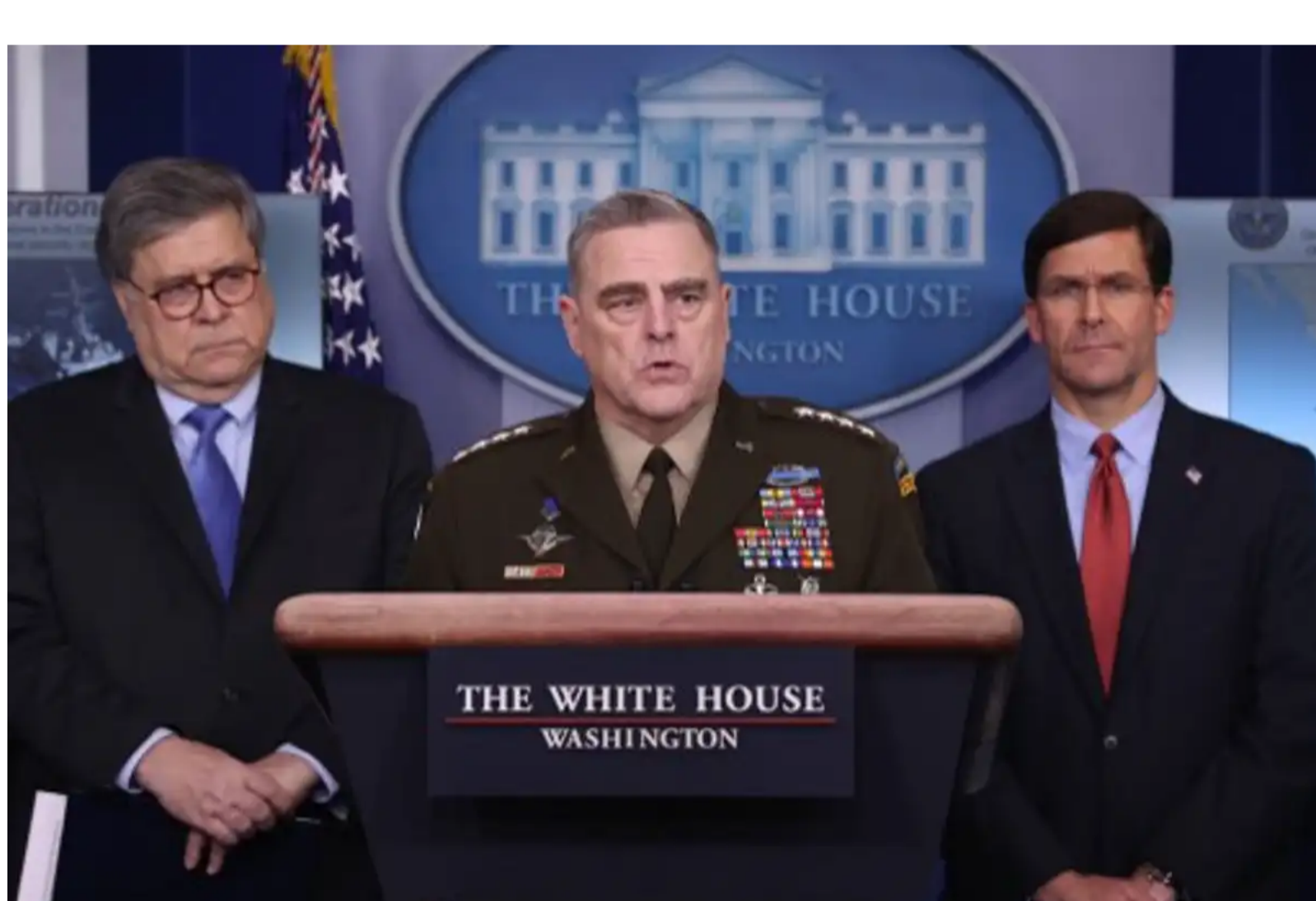
Explications sur la mobilisation militaire face au Covid-19 à la Maison Blanche.

Plus récemment l'armée américaine, confrontée à un changement profond de son environnement à la fin du XX e siècle (fin de la guerre froide, opérations de maintien de la paix, terrorisme international, etc.) a dû revoir profondément sa doctrine. Les attaques terroristes du 11 septembre et les guerres d'Afghanistan et d'Irak ont renforcé la nécessité d'avoir des outils pour penser l'inconnu et plus précisément pour prendre des décisions en situation d'incertitude, autrement dit être stratégique.