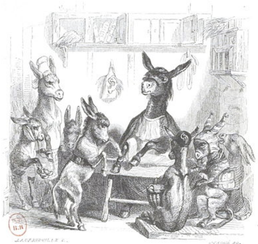
Grandville, illustration du Guide-âne 7

(travail forcé, expérimentation scientifique, etc.) parcourent d'ailleurs presque tous les textes et nous invitent à lire dans l'anthropomorphisme un projet politique animaliste.