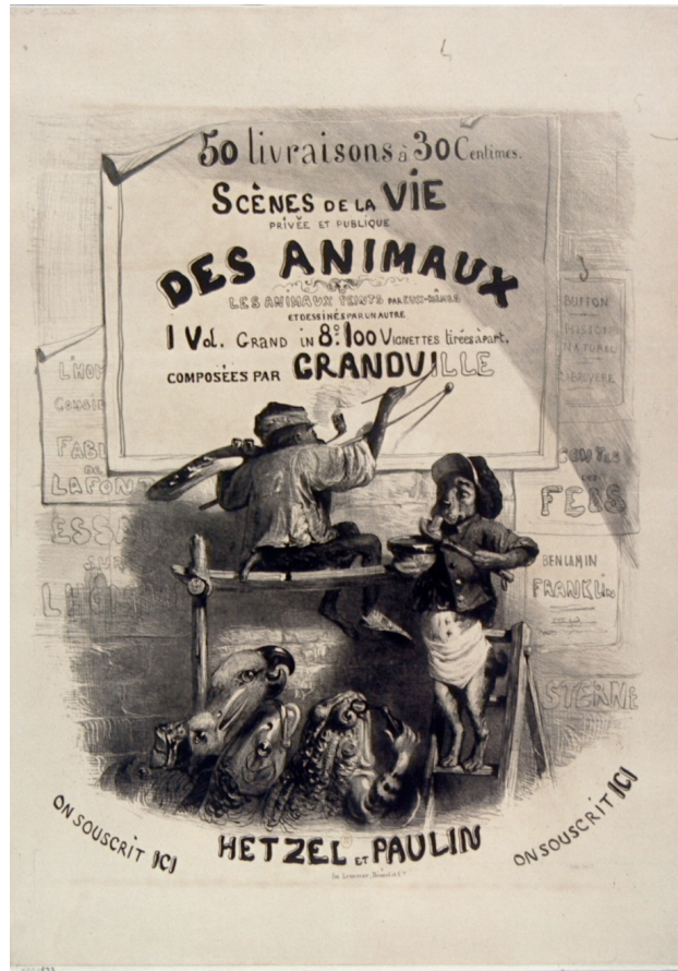
Grandville, Scènes de la vie privée et publique des animaux , affiche, 70x53cm, conservée à la BNF, site Richelieu, 1840.

À ces deux volumes ont collaboré toutes les grandes plumes de la Restauration et de la Monarchie de Juillet : Balzac, Nodier, Musset (Paul et Alfred), Sand, Hetzel lui-même. À l'orée du premier volume, Louis Français représente Hetzel, Balzac, Janin et Nodier, en cage, dans le jardin des plantes, dessinés par Grandville, assis sur un livre, et observés par des oiseaux badauds en liberté.