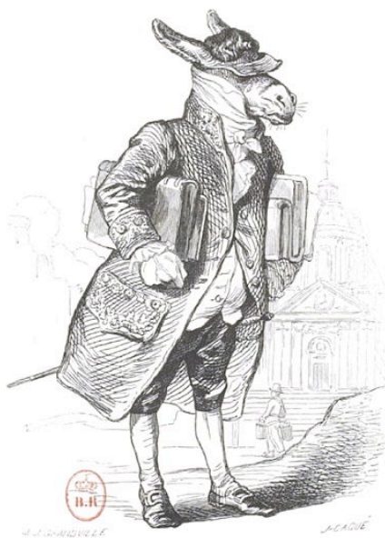
Grandville, illustration du Guide-âne 10

Parmi les textes fictionnels de Balzac, toute l'originalité du Guide-âne est de raconter la querelle des Analogues à la première personne et d'en faire le récit du point de vue d'un âne. Ce dernier vit en effet dans sa chair le conflit des modèles : ce qui pour nous n'est que théorie , est pour lui pratique , car il sert de cobaye à un maître, Marmus, dont les positions sont à peu de choses près celles de Geoffroy Saint-Hilaire, dans le conflit qui l'oppose au baron Cerceau, dont les théories sont celles de Cuvier. L'âne en vient donc à s'interroger lui-même, de son point de vue d'âne, sur l'unité de composition, sur la transmission des savoirs (ou des pratiques) chez les animaux, sur l'instinct animal et l'intelligence qu'il a en partage avec tous les autres animaux, y compris les hommes.