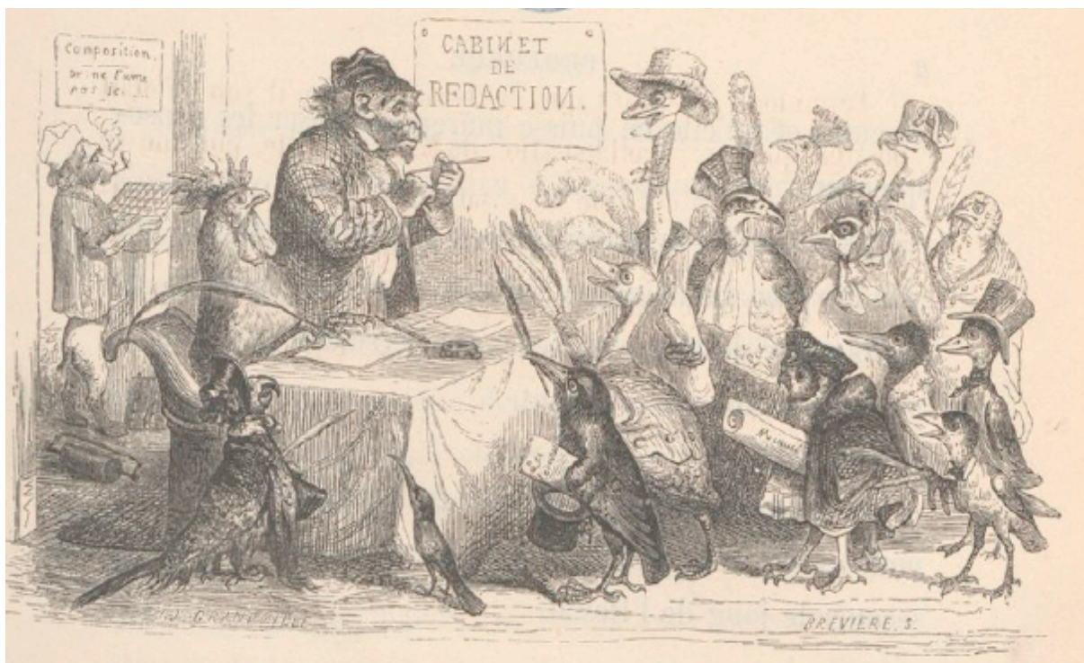
Grandville, illustration du « Prologue »

Si ces apologues reprennent les codes de la fable classique, ils n'en reprennent pas tout à fait l'esprit – ou du moins infléchissent-ils un peu la tradition. Ils sont précédés de trois textes d'une Préface rédigée par Hetzel (signée de son nom de plume, Stahl) et d'un « Prologue » mettant en scène les animaux tous ensemble.