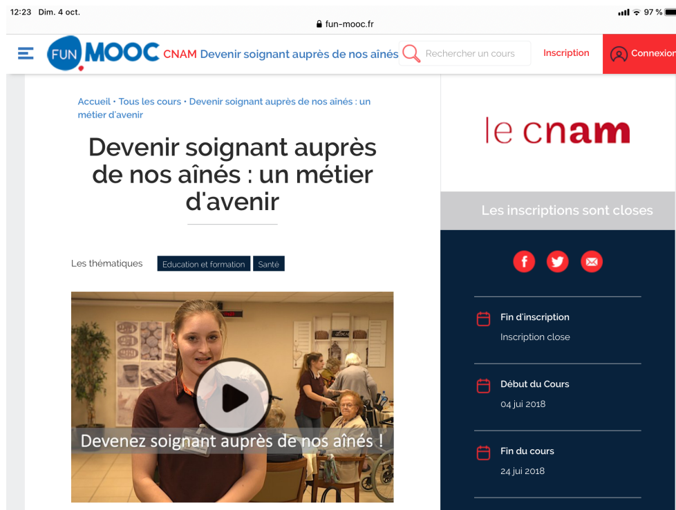
Figure 1 : Donnée empirique : la page de présentation du Mooc

leur candidature par courrier électronique aux services de recrutements mobilisés et préparés à les accueillir). La branche professionnelle a orienté le Mooc vers un métier en tension selon la définition de Pôle emploi, c'est-à-dire où il y avait un fort besoin de recrutement. La faiblesse liée à la durée de formation est compensée par un fort besoin de recruter qui amène les lauréats à s'inscrire dans un métier et à poursuivre leurs apprentissages dans l'organisation qui les rémunère (50 recrutés à l'issue de l'expérimentation)