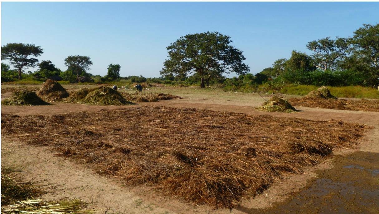
Photo. La parcelle utilisée comme « thalin » sur le terrain de football de Pawn Gyo. (© Stéphen Huard).

niveau local après le coup d'État du général Ne Win en 1962 qui marque le début du gouvernement militaro-socialiste.