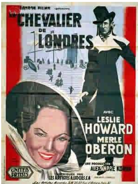
L'affiche française du Chevalier de Londres , sorti deux ans après la sortie au Royaume-Uni, dans une version en partie censurée avec un scénario bouleversé au doublage.