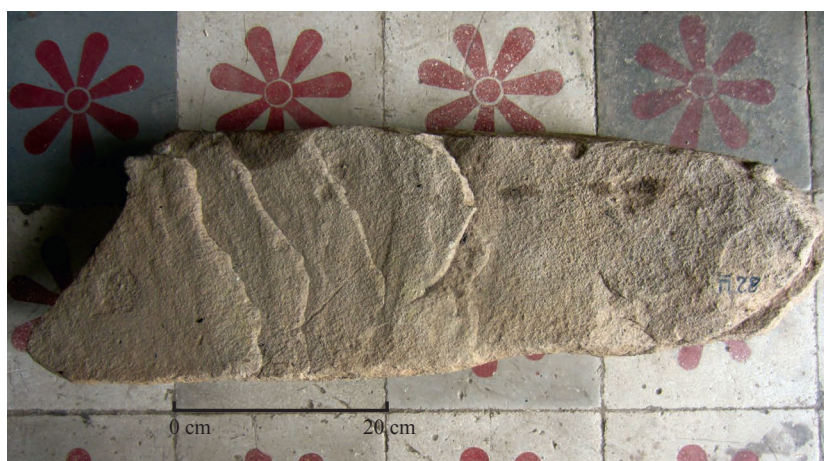
Fig. 3 — Photographie de l'arrière du support de l'inscription K. 1373.