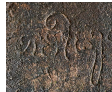
Fig. 1 — Le mot bhaviṣya : exemple paléographique d'une voyelle i brève descendant à droite, tiré de l'inscription K. 341-S (673 de n. è., l. 2).