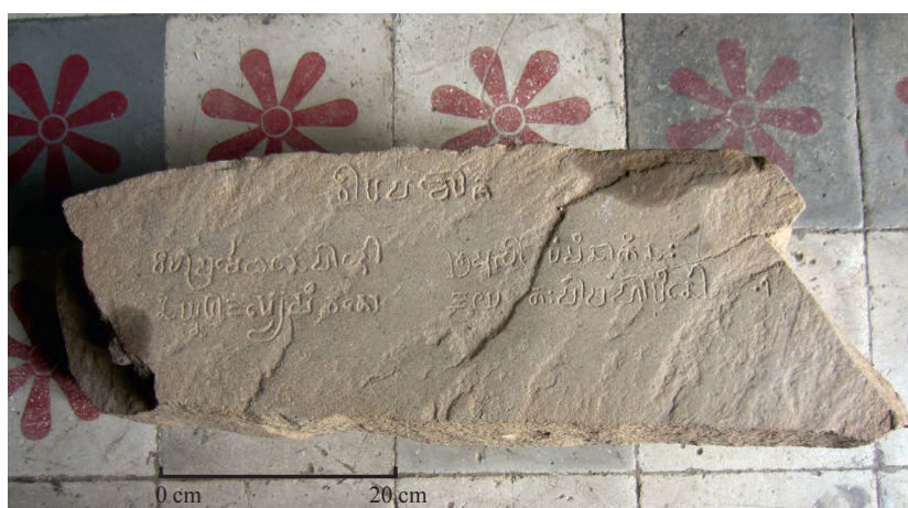
Fig. 2 — Photographie de l'inscription K. 1373.