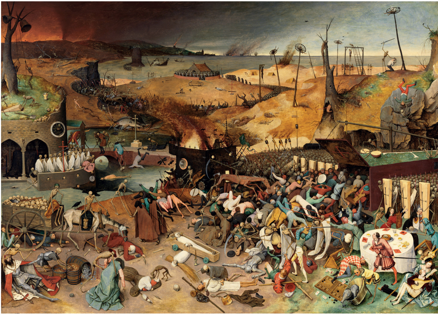
Pieter Bruegel l'Ancien, Le Triomphe de la Mort , 1562 huile sur bois, 117 x 162 cm, Musée du Prado, Madrid