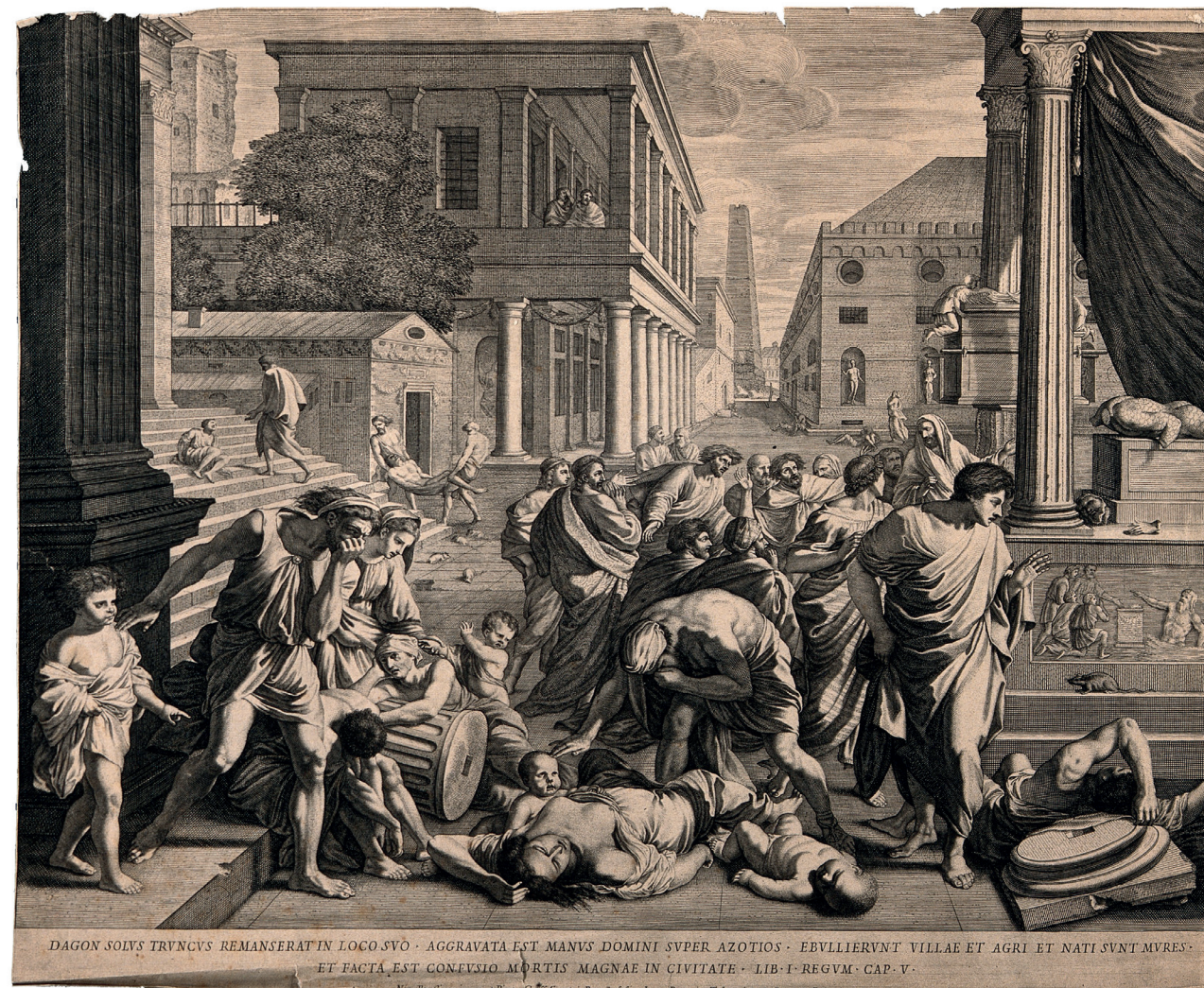
Jean Baron, d'après Nicolas Poussin, La Peste d'Asdod , 1650 gravure, Paris, Bibliothèque nationale de France, département des Estampes et de la photographie

En dehors d'interventions anthropiques spécifiques comme l'embaumement, ou de conditions atmosphériques et hygrométriques particulières permettant une momification naturelle, la mort d'un être humain ou d'un animal marque le début d'un processus de décomposition du corps qui conduit à la transformation du cadavre en squelette. Durant ce processus, le corps mort est source d'émanations variées. Ce sont d'abord les émanations gazeuses, provoquées par la prolifération des bactéries qui gonflent l'estomac et les intestins, parfois jusqu'à l'explosion de la paroi abdominale, provoquant des odeurs de corruption marquées. Puis des liquides suintent et s'écoulent des orifices du corps avant que les chairs elles-mêmes ne se liquéfient peu à peu pour disparaître et ne laisser que les os secs et stables – dont les transformations seront désormais lentes, silencieuses et inodores.