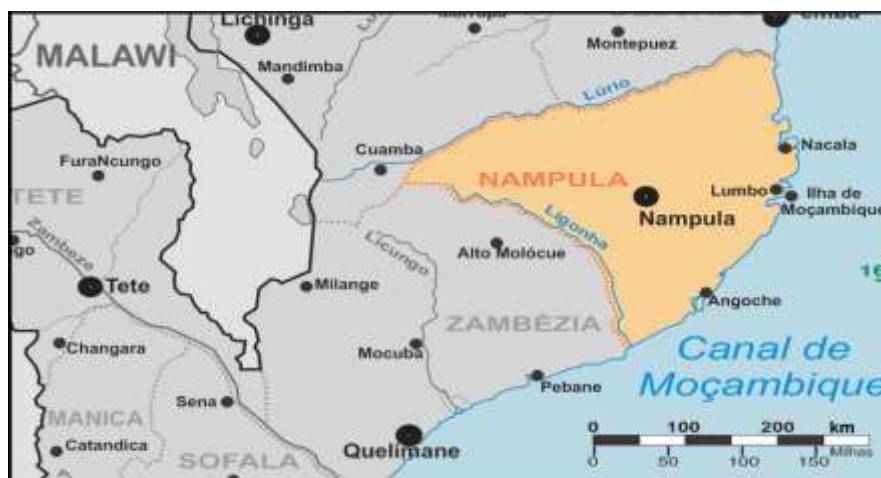
Mapa 4. A cidade de Nampula no mapa da província de Nampula