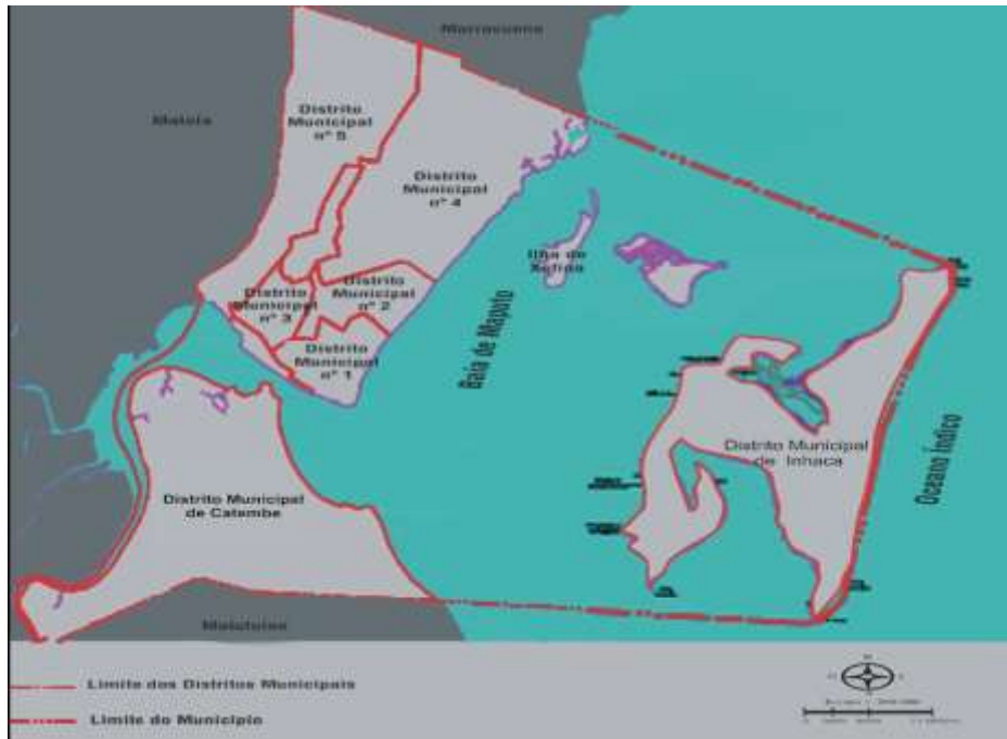
Carte 1. Les districts de Maputo