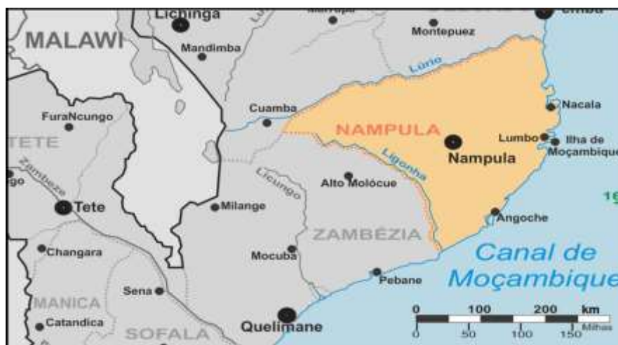
Carte 4. La ville de Nampula sur la carte de la province de Nampula

Administrativement, la ville de Nampula est une municipalité, mais elle n'appartient pas au district rural de Nampula. L'expansion entière de la ville se fait aux dépens de cette entité administrativement différente (Araújo 2005, p. 210). Elle se compose de 6 postes administratifs, à savoir: Central, Muatala, Muhala, Namicopo, Natikire et Napipine, qui englobent 18 quartiers (Araújo 2005).