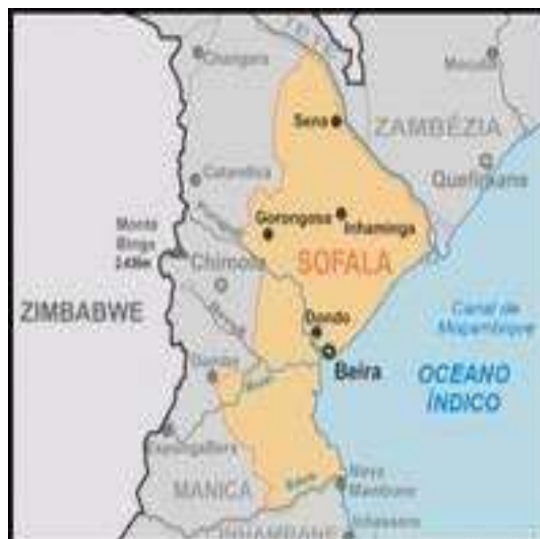
Carte 2. La ville de Beira sur la carte de la province de Sofala

Après 5 ans, en 1892, Beira a été élevée à la catégorie d'agglomération urbaine, une désignation purement légale, car elle ne répondait pas aux exigences de la transition. Ce noyau de population était destiné à soutenir la pénétration européenne et servait de limite entre les parcelles de terrain sous la juridiction de l'État et de la Compagnie du Mozambique (Companhia de Moçambique) concessionnaire de la vaste zone qui l'entoure (Amaral 1969).