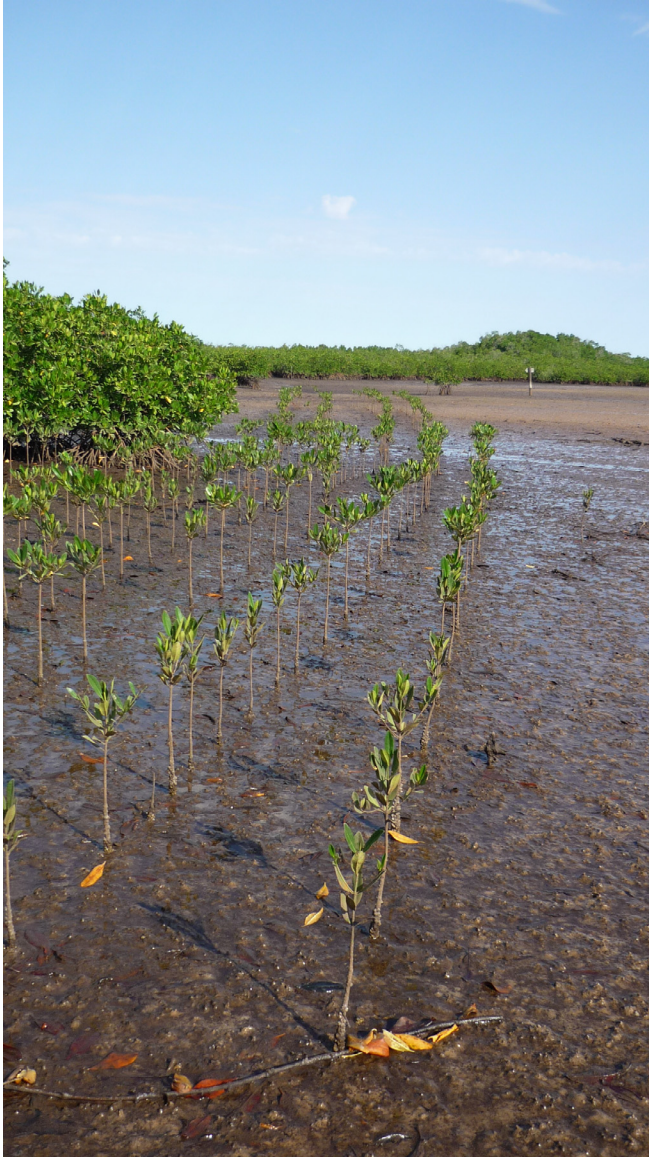
Fig. 4. Plantation de palétuviers Rhizophora pour le reboisement de mangroves, dans le delta du Saloum.

entre opérations de reboisement et biaisé les motivations des participants. L'inattention portée à la nature des sols aurait conduit à des aberrations : des plantations ont eu lieu sur des vasières sursalées ou à l'inverse sur des espaces auparavant propices à l'accueil des oiseaux et la récolte de coquillages. Dans une publication récente, les représentants d'Oceanium veulent restaurer leur crédibilité scientifique : depuis 2008, les sites de reboisement sont géolocalisés et la croissance des plantations suivie (Sall et Durin, 2012). Mais ce virage relève aussi des exigences des bailleurs : le mécénat de 4 millions d'euros de Danone est un mécanisme de compensation carbone, inopérant dès lors que les plants de mangroves ne croissent pas. Dans le