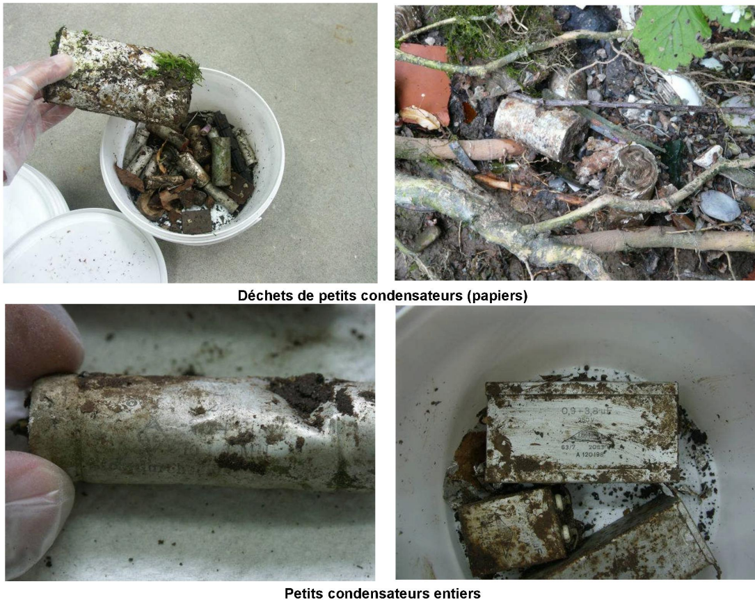
Fig. 3. Légende : Exemples de condensateurs imprégnés de PCB retrouvés dans le corps de la décharge.