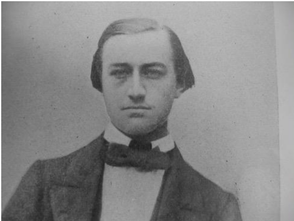
Henry DUVEYRIER à 16 ANS. Portrait anonyme figurant en frontispice de l'édition posthume du journal de voyage de 1857 de Duveyrier, assurée par Charles Maunoir en 1900 ( Journal d'un voyage dans la province d'Alger , Paris, Augustin Challamel, 1900 ; réédition, 2006, Éditions des Saints Calus)

Français venaient d'investir au prix d'un horrible carnage, et y écrivit à Armand du Mesnil des lettres qui portent le deuil d'une « ville à moitié morte et de mort violente 3 ».