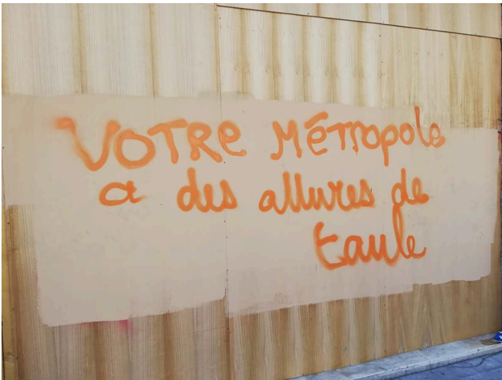
III. 2 : « Votre métropole a des allures de taule », graffiti, Toulouse, 2018