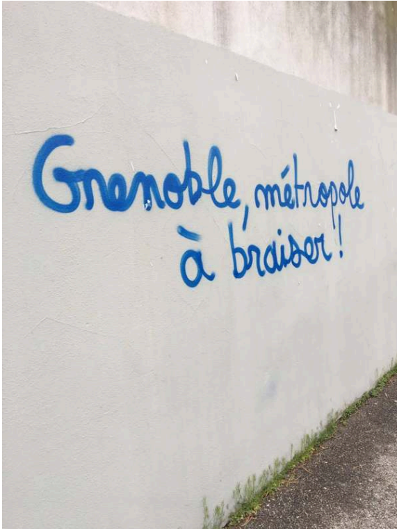
III. 1 : « Grenoble, métropole à braiser ! », graffiti, Grenoble, 2017