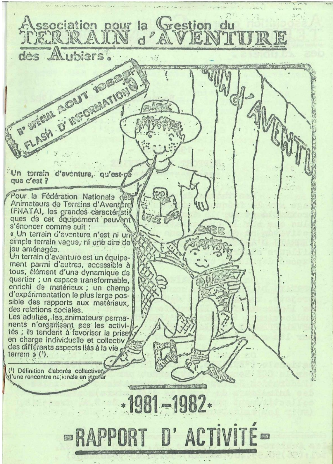
Document extrait du dossier concernant la Fédération nationale des associations régionales des animateurs de terrains d'aventure. Archives nationales, 19870093/1.