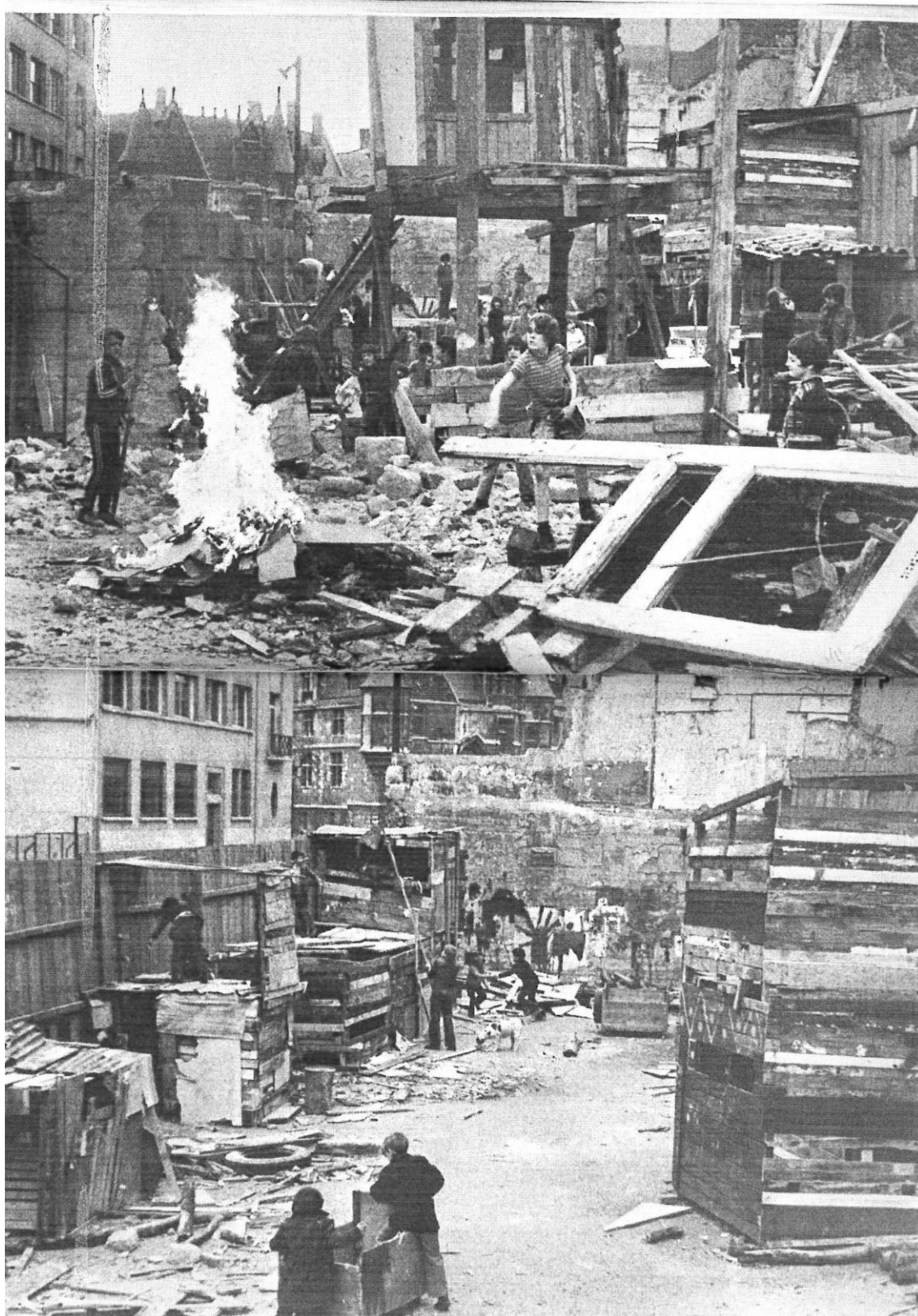
Photo du terrain d'aventure de la rue Saint-Paul à Paris, extraite de Marie-José Chombart de Lauwe et al. (1976 : 230-31).

Raveneau G., 2014, « L'expérience des terrains d'aventure en France dans les années 1970-80, une aventure sans lendemain ? », colloque Des lieux pour l'éducation populaire : conceptions, architecture et usage des équipements depuis les années 1930, St Denis, Archives nationales, École nationale supérieure d'architecture Paris-Malaquais, PAJEP, 3-5 décembre 2014.