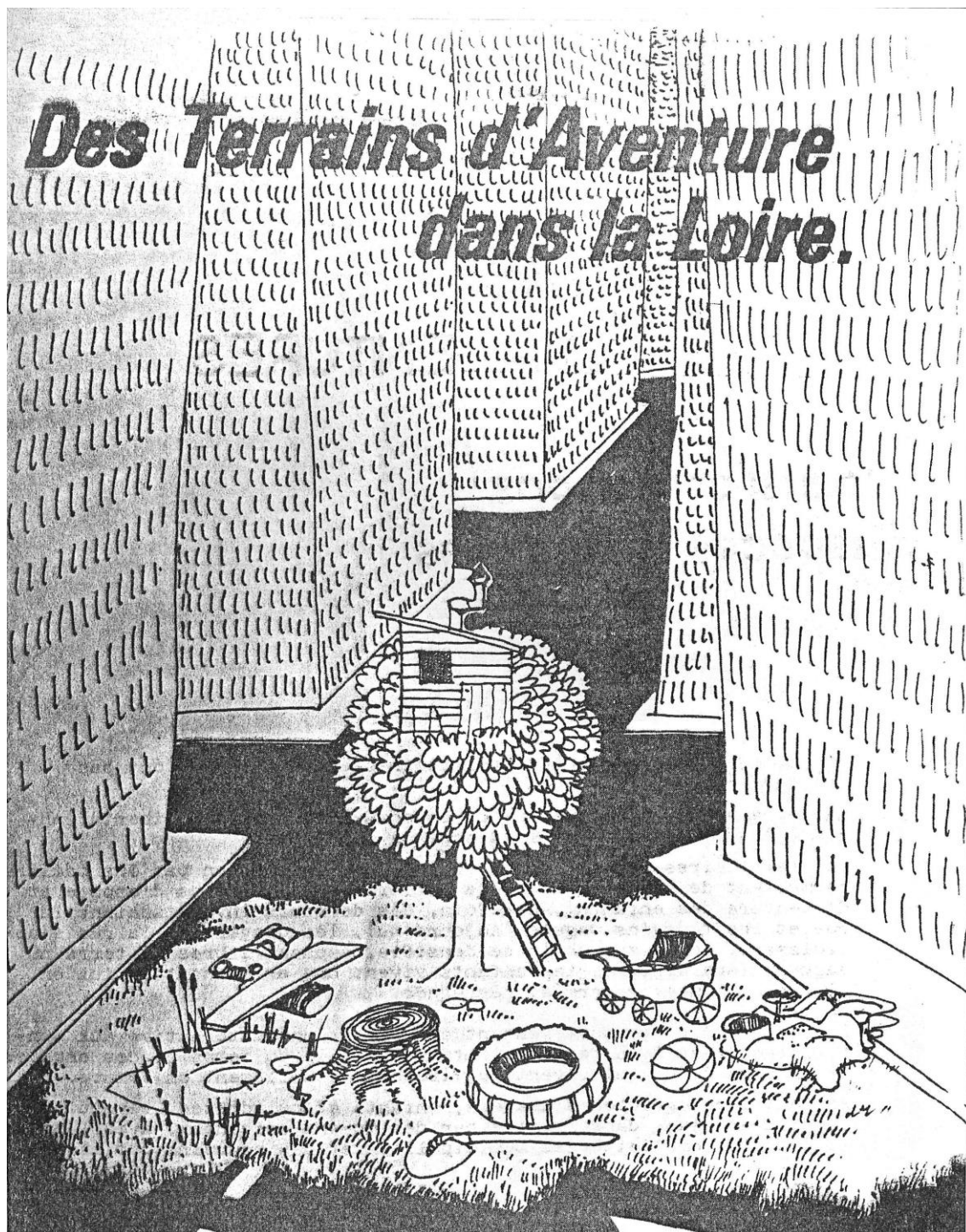
Document extrait du dossier concernant l'association pour la gestion du terrain d'aventure des Aubiers. Archives nationales, 19870093/1.

d'aventure en attendant de trouver mieux. Les exemples abondent de ces terrains pour l'aventure obligés de fermer malgré la contestation et la lutte des enfants, accompagnés par les familles et les associations gérantes des terrains. La propriété des terrains n'étant