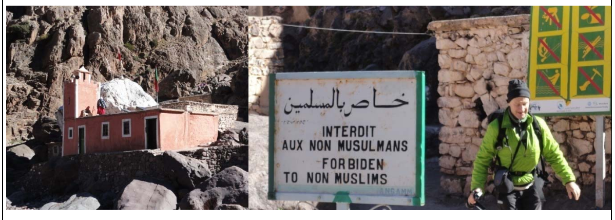
Figure 5 - Aux alentours du marabout de Sidi Chamharouch...