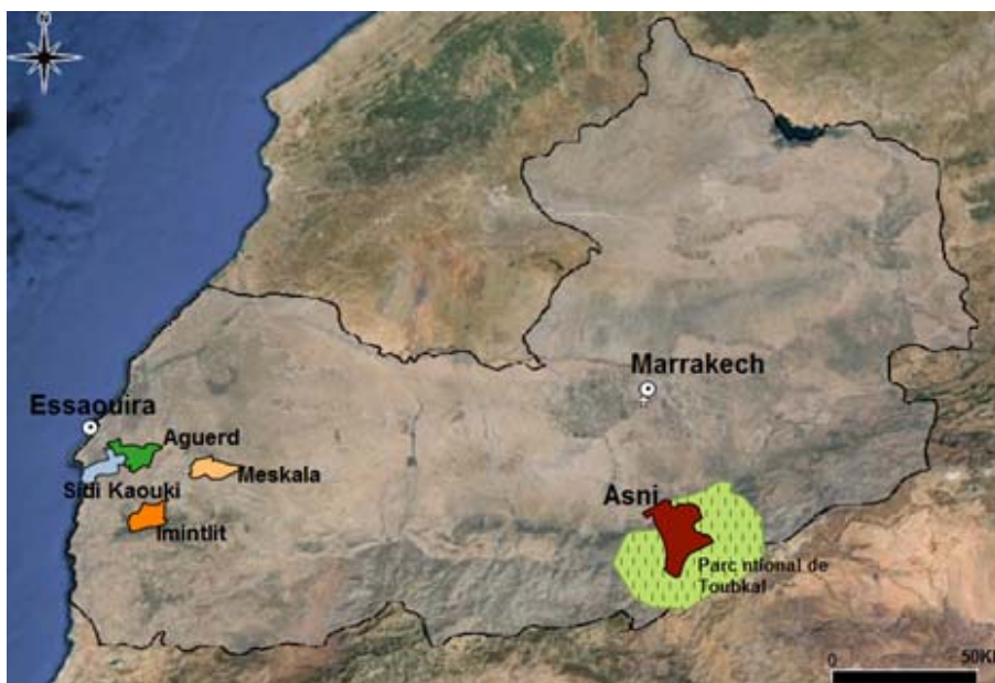
Figure 1 - localisation des communes étudiées.