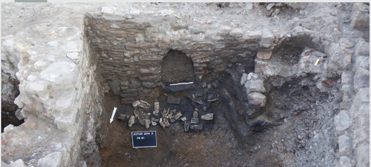
Fig. 2 Répartition des figurines à l'état 4 (D'après THIVET 2014) et vue du dépôt de valves de moules au fond du præfurnium 61.