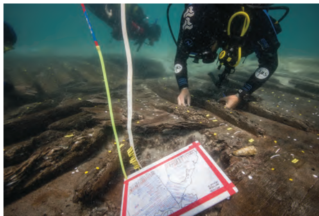
Dokumentiranje olupine iz Debeljaka / Documentation de l'épave de Debeljak

Ce voilier nous permet de mieux cerner les types de bateaux ayant sillonné l'Adriatique à la fin de l'Antiquité. C'est à cette époque que, dans d'autres régions de la Méditerranée, a commencé la lente évolution ayant conduit d'une construction « sur bordé » à une construction « sur membrure ».