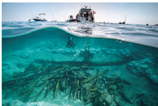
Pogled na prednji dio olupine s teretom drva / Vue de la zone avant de l'épave avec le chargement de bois

Malgré le peu d'informations recueillies sur l'architecture du navire, celui-ci devait présenter une forme inédite caractérisée par une proue à étrave droite ou renversée.