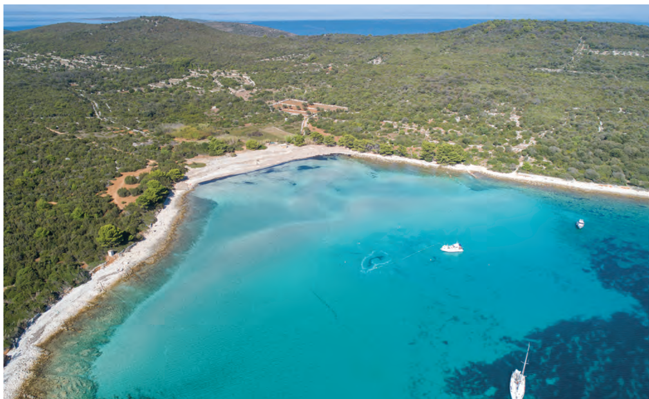
Uvala Paržine, otok Ilovik / La baie de Paržine, île de Ilovik

L'épave a fait l'objet de deux sondages. Le premier a restitué un fragment du complexe d'étrave long d'une dizaine de mètres et assemblé à quelques virures du bordé par des tenons chevillés. Plusieurs éléments de la coque mélangés à une multitude de troncs et branches, des pièces de gréement, des amphores appartenant au chargement et des éléments du mobilier de bord, ont aussi été retrouvés.