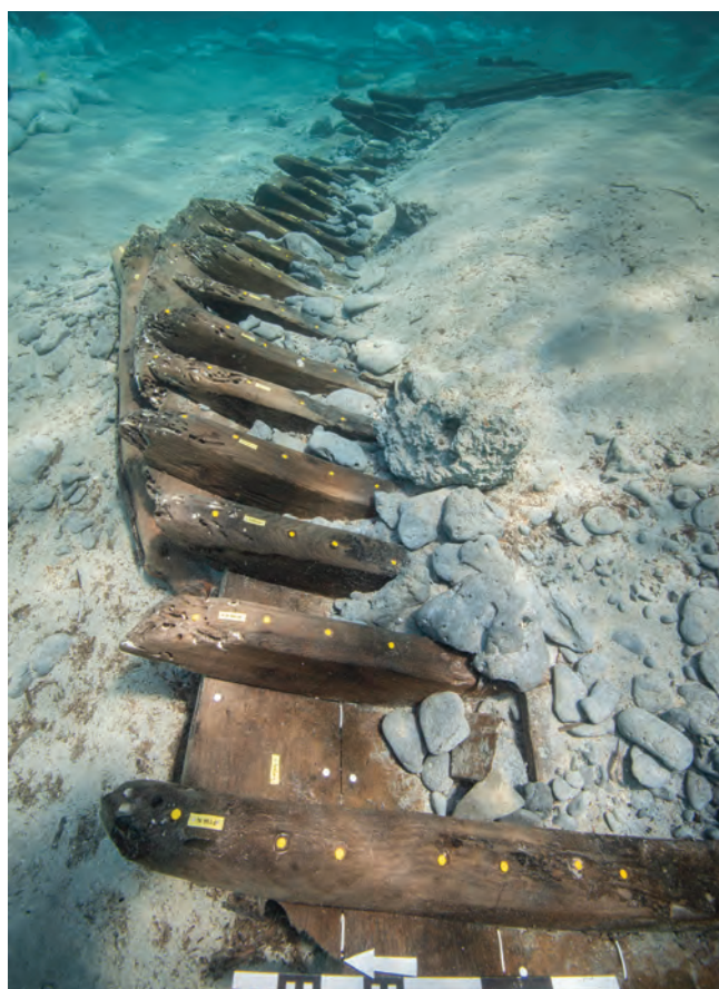
Topografija krmenog dijela broda / Topographie dans la zone arrière du navire