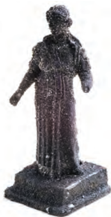
Brončana statueta otkrivena tijekom istraživanja / La statuette en bronze découverte sur l'épave

Unatoč nedostatku informacija o brodskoj konstrukciji, čini se da je pramac imao neuobičajen oblik te se odlikovao ravnom ili konkavnom pramčanom statvom.