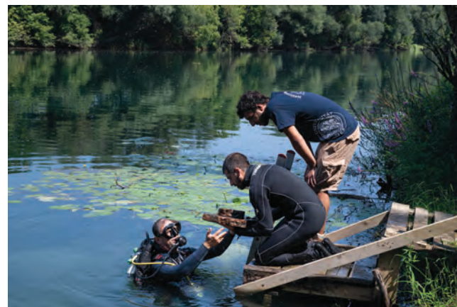
CATALOGUE DE L'EXPOSITION

Pregled opeka izvađenih tijekom istraživanja / Les archéologues examinent les briques récupérées lors de la fouille