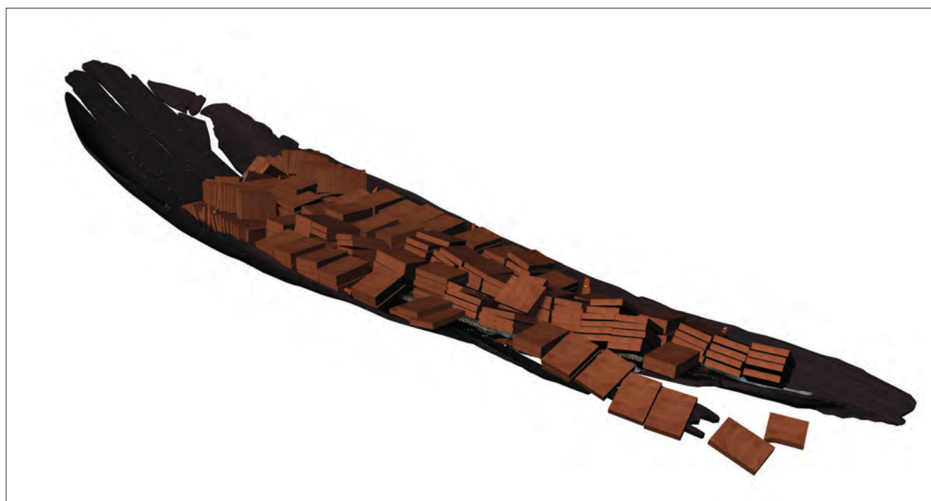
3D model olupine iz Kamenskog / Modèle 3D de l'épave de Kamensko Model / réalisation: A. Divić